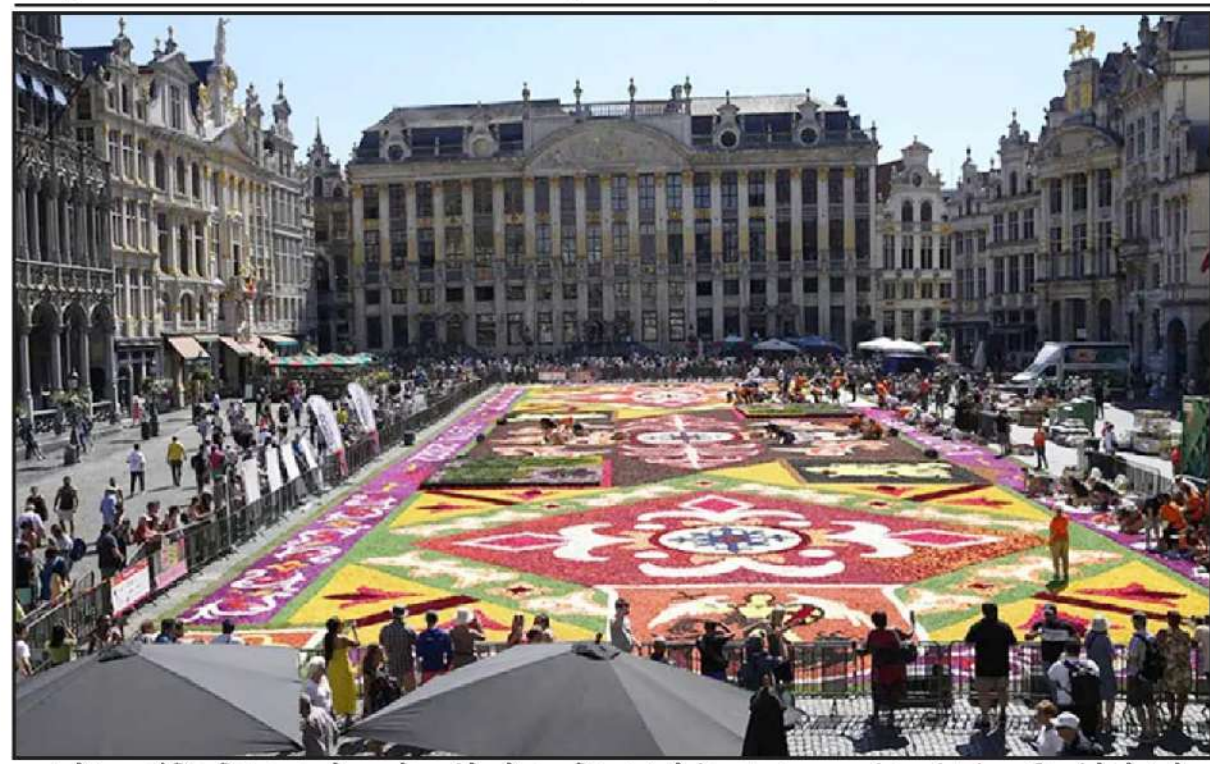
બ્રુસેલ્સના ઐતિહાસિક ગ્રાન્ડ પ્લેસ ખાતે સ્વયંસેવકો દ્વારા વિશાળ ફુલોનું જાજમ બનાવવામાં આવ્યું હતું. તસ્વીરમાં તેઓ ફુલોના જાજમને આખરી ટચ આપતા જણાય છે. જેને જોવા માટે મોટી સંખ્યામાં લોકો ઉપસ્થિત રહ્યાં હતા.

ગેરકાયદેસર છે. આ યુરોપનો સૌથી લાંબો આઈસ રોડ છે, એટલે કે આ જગ્યા પરનો રોડ કોઈકીટનો નથી, પણ જામી ગયેલો બરફ છે. અહીં વાહન ચલાવતા લોકો માટે સીટબેલ્ટ પહેરવાની સખત મનાઈ છે અને