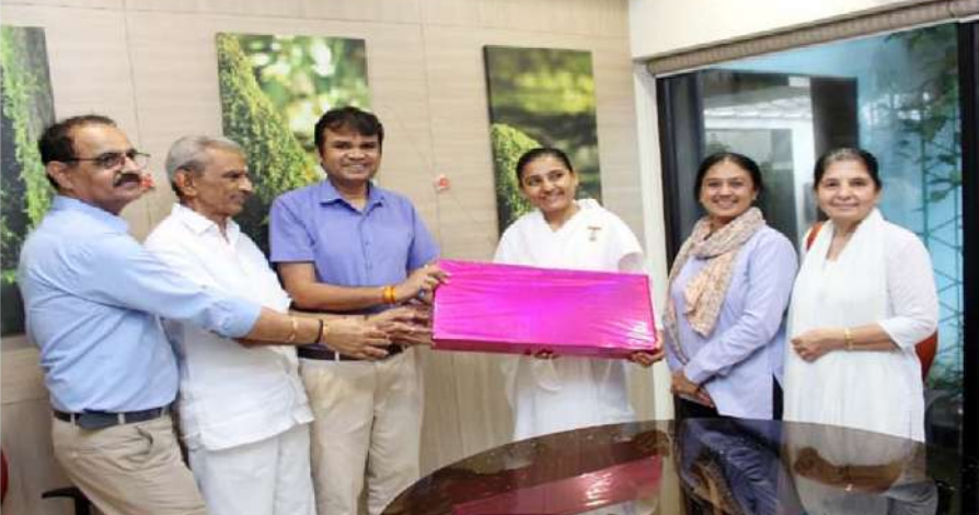
ચરોતર ગેસ સહકારી મંડળી લિમીટેડમાં રક્ષાબંધન પર્વની ઉજવણી કરવામાં આવી હતી.

(સંપૂર્ણ સમાચાર સેવા) શક્તિપીઠ પાવાગઢ ખાતે પણ ઈતિહાસમાં પ્રથમ વખત મંદિર પરિસરમાં રાષ્ટ્રધ્વજ ફરકાવવામાં આવ્યો. પાવાગઢ ખાતે આ નજરો ખાસ બની રહ્યો. જ્યાં ધર્મ ભક્તિ અને રાષ્ટ્ર ભક્તિનો સમન્વય જોવા મળ્યો. પાવાગઢ મંદિરમાં ઐતિહાસિક ક્ષણ સર્જાઈ હતી. મંદિરના ઈતિહાસમાં પ્રથમ વખત કાલિકા માતાની મંદિરમાં આરતી બાદ રાષ્ટ્રગાન કરાયું હતું. આઝાદી કા અમૃત મહોત્સવ અંતર્ગત મંદિર ટ્રસ્ટીઓ અને ઉપસ્થિત માઈ ભક્તોએ રાષ્ટ્રગાન કર્યું હતું. નિજ મંદિરનું ગર્ભ ગુહ રાષ્ટ્ર ભક્તિથી ગુંજ ઉઠ્યું હતું. પ્રથમ ગર્ભ ગુહમાં પહેલા આરતી કરાઈ હતી, અને બાદમાં રાષ્ટ્રગાન કરાયું હતું. નિજ મંદિરમાં પહેલીવાર રાષ્ટ્રધ્વજ લહેરાવાયો હતો. ભક્તોમાં પણ રાષ્ટ્રભક્તિનો અનેરો ઉત્સાહ જોવા મળ્યો હતો. આ ક્ષણે ભારતને વિશ્વગુરુ બનાવવા માઈ ભક્તો દ્વારા પ્રાર્થના કરાઈ હતી. પાવાગઢ નિજ મંદિરમાં દેશભક્તિનો રંગ જોવા મળ્યો. મંદિર ટ્રસ્ટીઓ સહિત અગ્રણીઓ ઉપસ્થિત રહી આ ઐતિહાસિક ક્ષણને વધાવી હતી. મા મહાકાળીના સાંનિધ્યમાં દેશભક્તિનું વાતાવરણ સર્જાયું.