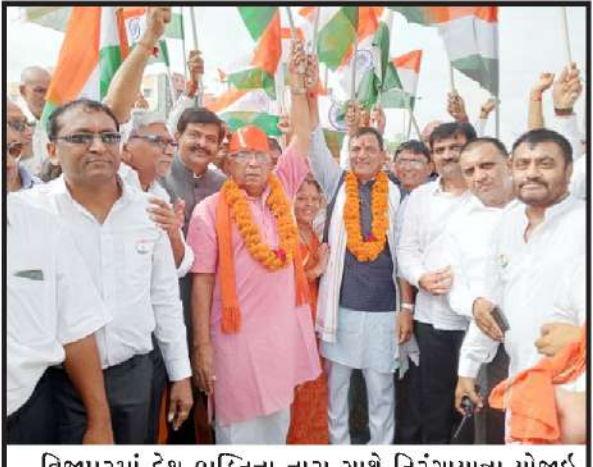
વિજાપુરમાં દેશ ભક્તિના નારા સાથે તિરંગા યાત્રા યોજાઈ હતી.