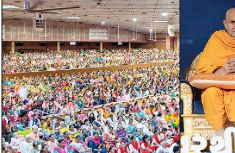
પ.પૂ. પ્રમુખ સ્વામી મહારાજે સમાજ અને રાષ્ટ્ર માટે ઘણું કર્યું છે

અમદાવાદ, તા. ૧૩ રાજ્યમાં આજે કોરોના વાયરસના નવા ૫૬૫ કેસ નોંધાયા હતા. કોરોનાથી રાજકોટ શહેર, મહેસાણા અને ભાવનગર શહેરમાં ૧-૧ મળી કુલ ૩ દર્દીઓના મોત નીપજ્યા હતા. આ સાથે રાજ્યનો કુલ મૃત્યુ આંક ૧૦,૯૮૦ ઉપર પહોંચ્યો છે. હાલમાં ૧૮ દર્દીઓ વેન્ટીલેટર ઉપર છે. જ્યારે ૪૧૮૭ દર્દીઓ સ્ટેબલ છે. રાજ્યમાં ૮૯૧ દર્દીઓને ડીસ્ચાર્જ કરાયા હતા. અમદાવાદ કોર્પોરેશન વિસ્તારમાં સૌથી વધુ ૧૯૧ અને જિલ્લા વિસ્તારમાં ૩ મળી કુલ ૧૯૪ અને જિલ્લા વિસ્તારમાં ૩ મળી કુલ ૧૯૪ કેસ નોંધાયા હતા. અન્ય કોર્પોરેશન વિસ્તારમાં નોંધાયેલા આંકડા મુજબ રાજકોટમાં ૫૮, વડોદરામાં ૪૦, સુરતમાં ૨૯, ગાંધીનગરમાં ૮, જામનગરમાં ૭ અને ભાવનગરમાં ૪ કેસ નોંધાયા હતા. જિલ્લા વિસ્તારમાં નોંધાયેલા આંકડા મુજબ ગાંધીનગરમાં ૨૭, કચ્છમાં ૨૫, વલસાડમાં ૨૨, સુરતમાં ૧૮, રાજકોટમાં ૧૫, પાટણ, વડોદરામાં ૧૪-૧૪, મહેસાણામાં ૧૩, નવસારીમાં ૧૨, બનાસકાંઠામાં ૧૧ કેસ નોંધાયા હતા. જ્યારે મોરબીમાં ૮, આણંદ, ભરૂચમાં ૬-૬, પોરબંદર, સાબરકાંઠામાં ૫-૫, દ્વારકા અને ગીર સોમનાથમાં ૪-૪ કેસ નોંધાયા હતા. આ ઉપરાંત અમરેલી, જામનગર, પંચમહાલમાં ૩-૩, અરવલ્લી, તાપીમાં ૨-૨, ડાંગ, જુનાગઢ અને સુરેન્દ્રનગરમાં ૧-૧ કેસ નોંધાયો હતો. રાજ્યમાં અત્યાર સુધીમાં ૧૨,૪૯,૬૫૯ દર્દીઓને કોરોનાને મ્હાત આપી છે. આ સાથે કોવિડથી સાથી થવાનો દર ૯૮.૮૦ ટકા જેટલો છે. રાજ્યમાં આજે કુલ ૨,૮૯,૫૪૬ વ્યક્તિઓને કોરોનાની રસી આપવામાં આવી હતી.