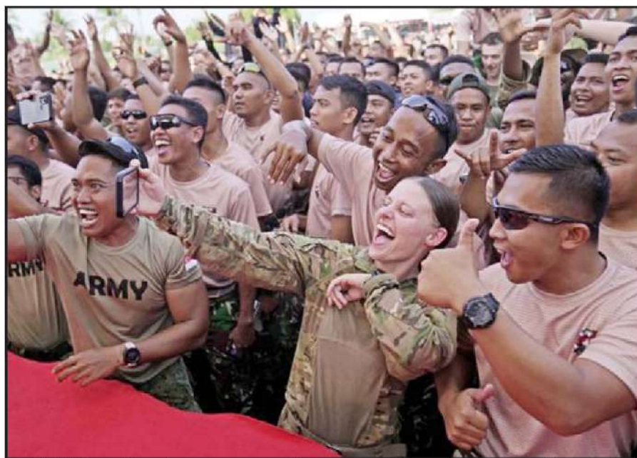
ઈન્ડોનેશિયામાં આયોજન સુપર ગુરુડ શિલ્ડ ૨૦૨૨ સંયુક્ત સૈન્ય અભ્યાસની પૂર્ણાહુતિએ અમેરિકન સૈનિકોએ સંગીત કાર્યક્રમ વખતે સેલ્ફી લીધી હતી, તસ્વીરમાં સૈનિકો ગીત ગાતા નજરે પડે છે.

અત્યાર સુધી તમે જોયું જ હશે કે રોડ પર સીટબેલ્ટ પહેરવો એટલું જરૂરી છે કે જો તમે તેમાં બેદરકાર રહેશો તો બિસ્સા ખાલી થઈ શકે છે. તમે સીટબેલ્ટ ન પહેરવા બદલ ચલણ કાપતું જોયું