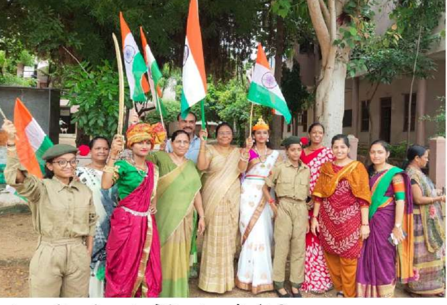
ધનસુરામાં ગ્રામ પંચાયત દ્વારા તિરંગા પટયાત્રા યોજાઈ હતી.