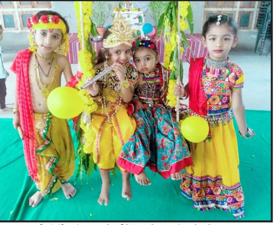
પાટણના શિશું મંદિરમાં જન્માષ્ટમી પર્વની ઉજવણી કરવામાં આવી હતી.