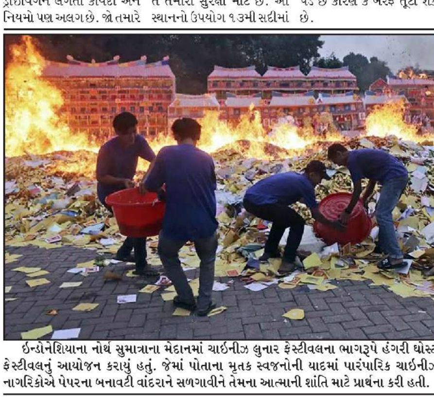
ઈન્ડોનેશિયાના નોર્થ સુમાત્રાના મેદાનમાં ચાઈનીઝ લુનાર ફેસ્ટીવલના ભાગરૂપે હંગરી ધોસ્ટ ફેસ્ટીવલનું આયોજન કરાયું હતું. જેમાં પોતાના મૃતક સ્વજનોની યાદમાં પારંપરિક ચાઈનીઝ નાગરિકોએ પેપરના બનાવટી વાંદરાને સળગાવીને તેમના આત્માની શાંતિ માટે પ્રાર્થના કરી હતી.

ઓહાયો,તા.૧૩ | સિનસિનાટી સ્થિત એફબીઆઈ ઓફિસમાં એક અજાણ્યા શખ્સે બંદૂક લઈને ઘૂસવાની કોશિશ કરી હતી. એફબીઆઈ અધિકારીએ તેને રોકવાની કોશિશ કરી ત્યારે બંને વચ્ચે ઝપાઝપી થઈ હતી. આખરે પોલીસે તેને ઠાર કરી દીધો હતો. ઓહાયો રાજ્યની હાઈવે પેટ્રોલ પોલીસના કહેવા પ્રમાણે સિનસિનાટીમાં આવેલી એફબીઆઈની ઓફિસમાં એક અજાણ્યો શખ્સે બંદૂક લઈને ઘૂસવાની કોશિશ કરી હતી. એ દરમિયાન એફબીઆઈ અધિકારીએ તેને રોકવાની કોશિશ કરી હતી. બંને વચ્ચે ઝપાઝપી થઈ હતી. કાર્યવિધનો એલાર્મ વાગ્યો હતો. એ પછી તેણે ભાગવાની કોશિશ કરી હતી, કારમાં ભાગતા પહેલાં આ શખ્સે પોલીસ પર ફાઈરિંગ કર્યું હતું. પોલીસે તેની કારનો પીછો કર્યો હતો. એક સ્થળે રોકાઈને તેણે પોલીસ પર ફાઈરિંગ કર્યું હતું. બંને તરફના ફાઈરિંગમાં પોલીસે આખરે તેને ઠાર કરી દીધો હતો.