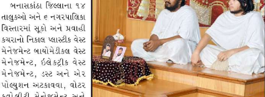
પાલનપુરમાં પિતા છે મહાન વિષય પર કાર્યક્રમ યોજાયો હતો.