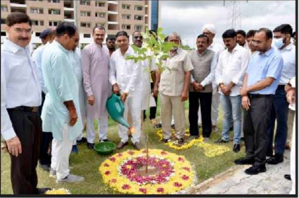
મોરીયા બનાસ મેડિકલ કોલેજમાં વન મહોત્સવની ઉજવણી કરવામાં આવી હતી.

પાલનપુર તા.૧૩ પાલનપુર તાલુકાના મોરિયા બનાસ મેડિકલ કોલેજ ખાતે ગ્રાહ્ય, નાગરિક પુસ્તકો અને ગ્રાહકોની બાબતોના મંત્રી તથા જિલ્લાના પ્રભારી મંત્રી ગજેન્દ્રસિંહ પરમારના અધ્યક્ષ સ્થાને ૮૩મું જિલ્લાકક્ષાના વન મહોત્સવની ઉજવણી વૃક્ષોરોપણ કરી કરવામાં આવી હતી. આ પ્રસંગે પ્રભારી મંત્રી ગજેન્દ્રસિંહ પરમારે વન મહોત્સવની શુભેચ્છા પાઠવતાં જણાવ્યું કે ચોમાસાની ઋતુમાં આપણા ઘેરની આજુબાજુ, ખેતરના શેઢે-પાળે વૃક્ષો રોપવાનું પવિત્ર કાર્ય કરવું જોઈએ. તેમણે કલાયમેન્ટ યેજના પડકારો અને વૃક્ષોનું મહત્વ સમજાવતાં જણાવ્યું કે વૃક્ષો મનુષ્યોના જીવનમાં જન્મથી લઈ મૃત્યુ સુધી આપણે સાથ કર્યારેય છોડતા નથી. ત્યારે દરેક વ્યક્તિએ વૃક્ષોનું મહત્વ સમજી વૃક્ષો વાવે તે જરૂરી છે.