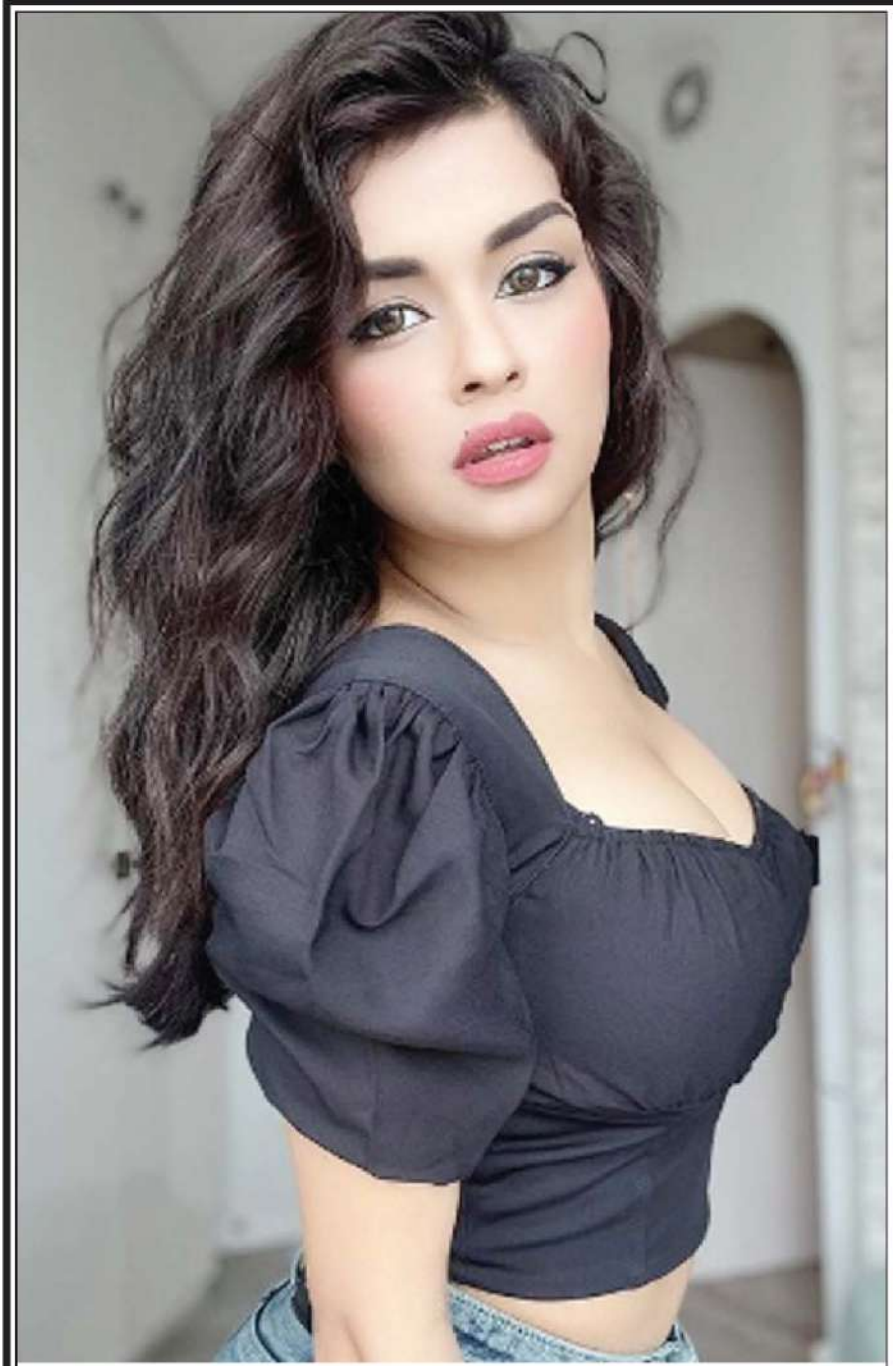
બોલીવુડ એક્ટ્રેસ અવનીત કૌરે હોટ અંદાજમાં પોતાની નવી તસ્વીર ચાહકો માટે શેર કરી છે, પોતાની આગામી ફિલ્મ રજૂ થતાં સુધીમાં તે ચર્ચામાં રહેવા બોલે અને હોટ તસ્વીરો શેર કરી રહી છે.