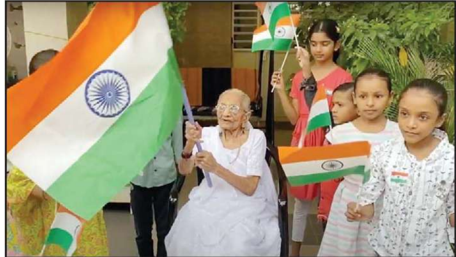
આઝાદીના અમૃત મહોત્સવની ઉજવણીના ભાગરૂપે 'હર ઘર તિરંગા' અભિયાન અંતર્ગત શનિવારે ગાંધીનગરના રાયસણમાં વડાપ્રધાન નરેન્દ્ર મોદીના માતૃશ્રી હીરાબાએ ૧૦૦ વર્ષની જૈકવચે પણ પોતાના નિવાસસ્થાને મધ્યમ વર્ગીય અને સામાન્ય પરિવારોના બાળકોને તિરંગાનું વિતરણ કર્યું હતું. તેમજ તેમની સાથે તેમણે પોતે પણ તિરંગો લહેરાવીને રાષ્ટ્રભાવના વ્યક્ત કરી હતી.

રૂ. ૨૪,૬૪,૦૦૦ જેટલો મુદામાલ કબજે કર્યો હતો. પોલીસે આ ઓફિસના કર્મચોરની પણ પૂછપરછ હોવાનું જાણવા મળ્યું હતું.