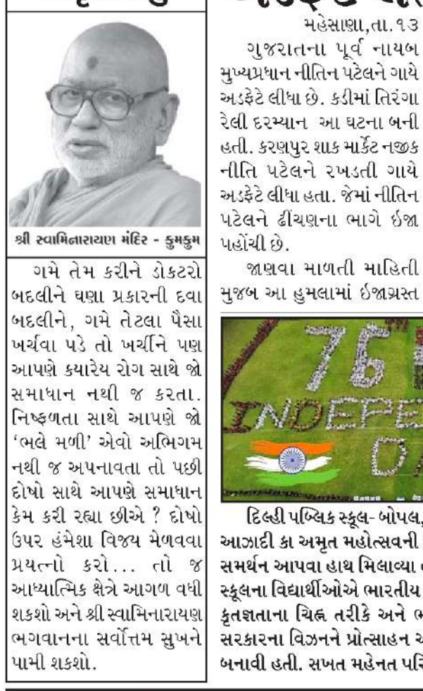
શ્રી રવામિનારાયણ મંદિર - કુમકુમ

અને રેન્કિંગમાં પાછળન રહે એ માટે મુખ્યમંત્રીના હસ્તે ગરમા સેલ સ્થપાયો છે. મુખ્યમંત્રી ભૂપેન્દ્રભાઈના સકારાત્મક અભિગમ, સતત સહયોગ અને માર્ગદર્શન હેઠળ શિક્ષણ ક્ષેત્રે અનેક આયામો સિધ્ધ થઈ શક્યા છે. શિક્ષણ મંત્રીએ ઉમેર્યું હતું કે, વડાપ્રધાન નરેન્દ્રભાઈએ મુખ્યમંત્રી તરીકે શિક્ષણ ક્ષેત્ર પર ખૂબ ફોકસ કર્યું હતું. જેને પરિણામે ગુજરાત એજ્યુકેશન હબ બની ગયું છે અને આવનારા સમયમાં ગુજરાત શિક્ષણ ક્ષેત્રે સરકાર સંશોધન પેપર લેખન એવી આશા છે.