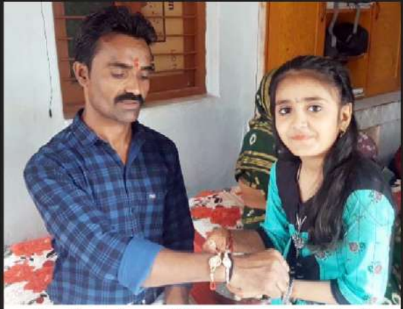
ડીસામાં રક્ષાબંધન પર્વની ઉજવણી કરવામાં આવી હતી.