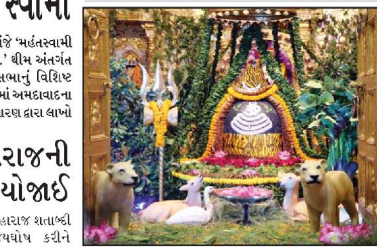
પવિત્ર શ્રાવણ વદ બીજના દિવસે ભગવાન સોમનાથ મહાદેવને લીલોતરી શૃંગાર દર્શન કરવામાં આવેલ તે તસ્વીરમાં નજરે પડે છે.

આ પ્રસંગે પ્રમુખસ્વામી મહારાજના અદિતીય ગુણોને નિરૂપતા પ્રવચનોની હારમાળા, વિદ્વાન અને વરિષ્ઠ સંતોના મુખે રજૂ થઈ હતી. ઉપસ્થિત વરિષ્ઠ સંતોએ પ.પૂ. પ્રમુખસ્વામી મહારાજના જ પ્રગટ સ્વરૂપ એવા પ.પૂ. મહંતસ્વામી મહારાજને પુષ્પમાળા અર્પણ કરી વધાવ્યા હતા. આજના દિવસે પ.પૂ. મહંતસ્વામીના હસ્તે સંસ્થાના સંગીતજ્ઞ સંતોના કંઠે ગવાયેલ પ્રમુખસ્વામી મહારાજના દિવ્ય સ્મૃતિ ભજનો 'પ્રમુખ પ્રમુખસ્વામી ધ્યારા' ધ્વનિ સુદ્રઘ પ્રકાશનનું ઉદ્ઘાટન કરવામાં આવ્યું હતું. આઝાદી કા અમૃત મહોત્સવ અંતર્ગત તેમણે કરેલી દેશસેવા અને સમાજ સેવાનું સ્મરણ કર્યું હતું.