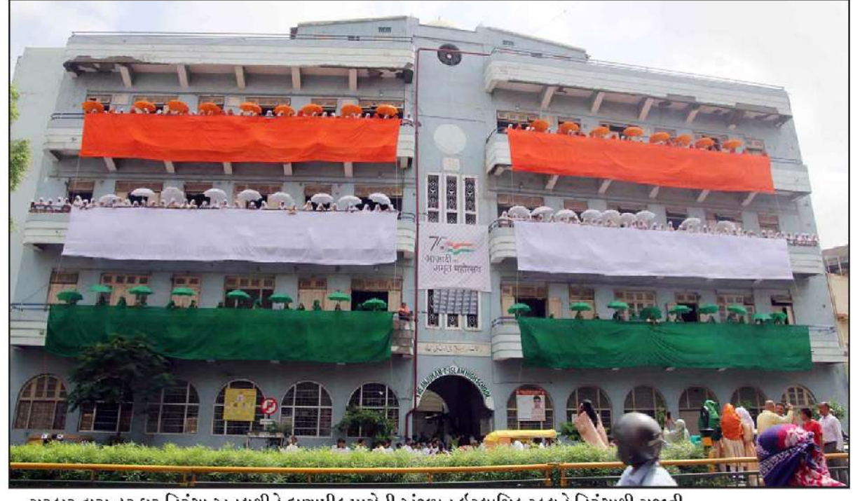
સરકાર દ્વારા હર ઘર તિરંગા અનુલક્ષીને દાણાપીઠ પાસેની અંજુમને ઈસ્લામિક સ્કૂલને તિરંગાથી સજાવી....

આપણે જ્યારે આઝાદીનો અમૃત મહોત્સવ ઉજવી રહ્યા છીએ ત્યારે દરેક સ્કૂલમાં વિદ્યાર્થીઓ માટે એક કલાકના વધારાના સેશનનું આયોજન કરવામાં આવે અને એમાં વિદ્યાર્થીઓને આઝાદી આંદોલનમાં થયેલા શહીદ વીરોની વાત કહેવામાં આવે જેથી વિદ્યાર્થીઓ આઝાદીના ઇતિહાસને વધુ નજીકથી જાણી શકે એમ તેમણે જણાવ્યું હતું.