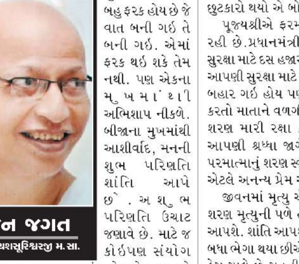
જૈન જગત - રાજ્યશસ્ત્રીશ્વરજી મ. સા.

આ નવું પુસ્તક દર્શાવે છે કે, કેવી રીતે જુદા- જુદા હિતધારકો ચોક્કસ ક્ષેત્રોમાં સફળતા મેળવવા એકજૂથ થઈ શકે છે હિતધારકો એકજૂથ થઈને મૂળભૂત રીતે સમગ્ર માળખાની પુનઃગોઠવણી કરી શકે છે તેની વિસ્તૃત માહિતી છે. કેન્દ્ર, રાજ્યો અને ત્રીજા શ્રેણી વચ્ચે આપદા પ્રબંધનના ક્ષેત્રમાં પ્રશાસન, સશક્તિકરણ અને સંકલનમાં સંપૂર્ણતાની ઉત્કૃષ્ટિ વિગતવાર વર્ણવવામાં આવી છે. જે વિજ્ઞાન, ટેકનોલોજી, એન્જિનિયરિંગ, ગણિત (અન્ય વસ્તુઓ પૈકી અનુમાન અને ઇમારત માપદંડો અને બીજાકામ સહિત પ્રતિરોધકતા માટે) અને સામાજિક વિજ્ઞાન (ધીરજ અને આજીવના નેટવર્કના ઝડપી પુનઃનિર્માણ માટે) આવરી લેતા વ્યાવહારિક અર્થમાં બહુઆયામી વિષયો છે. તે વહેલી ચેતવણી અને સ્વસહાય માહિતી અંગે લોકભિમ્યુષ્મ અભિગમ ધરાવે આપદા પ્રબંધન માટે ઉદાહરણ તરીકે વિજ્ઞાનના સમાજસાથે જોડાણદાર અને ચોક્કસ હેતુ માટે તૈયાર કરાયેલા કાયદા દ્વારા બહુસ્તરીય કાર્ય પ્રબંધન પ્રોટોકોલ ઈશ્ચિત સાધનોને સ્પષ્ટ, પ્રભાવશાળી અને કાર્યક્ષમ રીતે અમલમાં મુકવામાં સહાયરૂપ બને છે. પરિણામ સ્વરૂપે, સમગ્ર રીતે, પૂર્વ જાણકારી સાથે પ્રાકૃતિક પરિણામો વિપરિત હોય ત્યારે આ કોઈ બીજા વ્યક્તિએ ક્યું હોવાનો અરોપ-પ્રતિઅરોપ કરવામાં આવ્યો છે. જો કોઈ લક્ષ્યક પ્રાપ્ત કરવું હોય તો, ચોક્કસ ક્ષેત્રોમાં સફળતા મેળવવા કેવી રીતે વિવિધ (લેખક ભારતીય રિઝર્વ બેન્ક (આરબીઆઈ) ના પૂર્વ ગવર્નર છે)