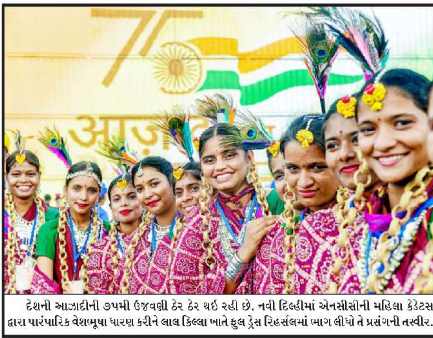
દેશની આઝાદીની ૭૫મી ઉજવણી દેર દેર થઈ રહી છે. નવી દિલ્હીમાં એનસીસીની મહિલા કેડેટસ દ્વારા પારંપારિક વેશભૂષા ધારણ કરીને લાલ કિલ્લા ખાતે કુલ ટ્રેસ રિહસલમાં ભાગ લીધો તે પ્રસંગની તસ્વીર.

નવી દિલ્હી, તા. ૧૩ દેશમાં ચેરીટેબલ ટ્રસ્ટો અને આ પ્રકારની સંસ્થાઓ દ્વારા રાજ્યમાં આવતા હિસાબોના નિયમોમાં મોટા ફેરફાર કરવામાં આવ્યા છે. સેન્ટ્રલ બોર્ડ ઓફ ડાયરેક્ટ ટેક્સ દ્વારા તમામ ચેરીટેબલ ટ્રસ્ટો, યુનિવર્સિટીઓ તથા તેઓને હિસાબો વ્યવસ્થિત રાખવા, પેમેન્ટના આંદોલન બીજા પગલે મેળવવા ઉપરાંત જે લોગો આ પ્રકારની સંસ્થાઓને દાન આપતા હોય તેના પાન ઉપરાંત આધાર કાર્ડના ટેકા અને સરનામા મેળવવા તથા ટ્રસ્ટ દ્વારા જે લોન મેળવવા હોય અથવા તો રોકાણ કરાવું હોય તેમાં પણ ટ્રસ્ટીઓને ડોનરના પાન-આધાર સહિતની માહિતી રાખવા આદેશ આપવામાં આવ્યા છે. આ ઉપરાંત તમામ ચેરીટેબલ ટ્રસ્ટોને છેલ્લા ૧૦ વર્ષના રેકોર્ડ પર રાખવા પણ સૂચના આપવામાં આવી છે જેના કારણે આવકવેરા વિભાગ તેના હિસાબોની યોગ્ય રીતે ચકાસણી કરી શકશે. ઉપરાંત તેમને વિદેશી મળતા બંધોળ અંગે પણ તેઓએ સ્પષ્ટ માહિતી રાખવી જરૂરી બનશે. આ ઉપરાંત ટ્રસ્ટ અને ઈન્સ્ટીટ્યુટ દ્વારા તેઓ જે પ્રોજેક્ટ હાથમાં લે તેમાં સ્વેચ્છિક દાતાઓ તથા ટ્રસ્ટ ફંડ ટ્રાન્સફરની માહિતી પણ સ્પષ્ટ રાખવાની રહેશે.