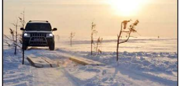
જે હિયુમા ટાપુના દરિયાકિનારા પર હાજર છે. અહીં ડ્રાઈવિંગ કરવું એ પોતાનામાં એક અલગ જ અનુભવ છે, પરંતુ અહીં ડ્રાઈવિંગને લગતા કાયદા અને નિયમો પણ અલગ છે. જો તમારે

આ રસ્તા પર વાહન ચલાવવું હોય તો વાહનના સીટબેલ્ટને થોડીવાર માટે ભૂલી જાવ, કારણ કે તેને પહેરવું ગેરકાયદેસર ગણાશે. આ સિવાય આ જગ્યાએ વાહનની સ્પીડ ૨૫-૪૦ કિમી પ્રતિ કલાકની રાખવી પડશે. તે વિચિત્ર લાગે છે, પરંતુ તે તમારી સુરક્ષા માટે છે. આ સ્થાનનો ઉપયોગ ૧૩મી સદીમાં