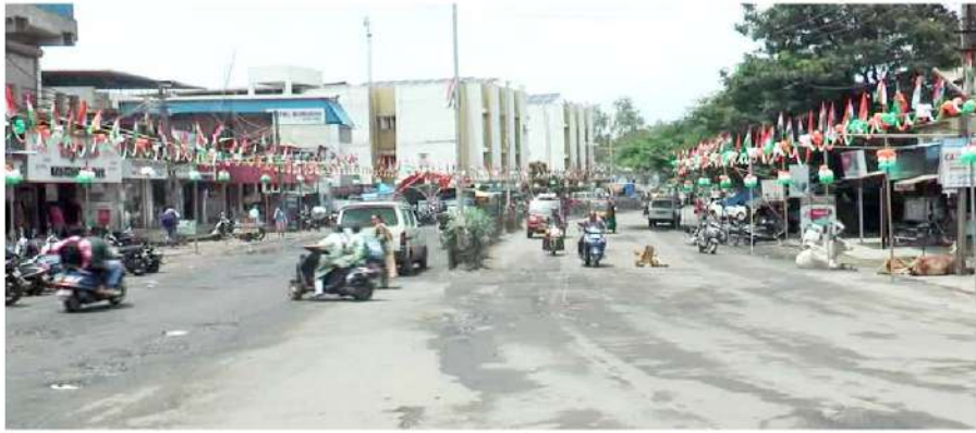
અંકલેશ્વર તિરંગાના રંગે રંગાયું હતું