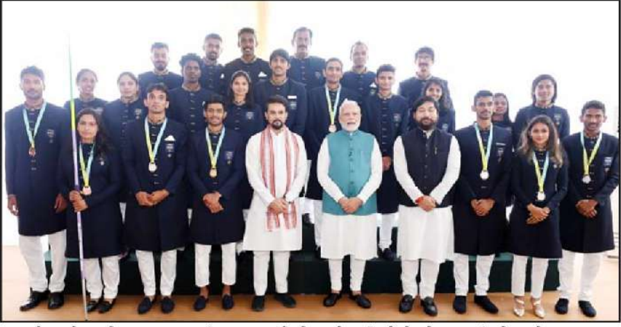
કોમનવેલ્થ ગેમ્સ-૨૦૨૨માં ભારતના વિજેતા બેલાડીઓએ પોતાના ચંદ્રકો સાથે વડાપ્રધાન નરેન્દ્ર મોદી, યુવા-રમતગમત મંત્રી અનુરાગ ઠાકુર મંત્રી નીશિત પ્રમાણિક સાથે સમૂહ તસ્વીર બેંચાવી હતી.

હુદીના શહે. હવે એશિયન ગેમ્સ અને ઓલમ્પિક તમારી સામે છે. રેણુકા સિંહે ગેમ્સમાં સૌથી વધારે વિકેટ લીધી. તેમણે દિકરીઓના પ્રદર્શનથી સમગ્ર દેશ ગદગદ છે. પૂજારી લઈને વિનેશએ નિરાશાને પાછળ છોડી. હરમનપ્રીત આ સિવાય સીનિયર પણ તેમનો ખૂબ સાથ નિભાવ્યો. પોઝિયમ પર વણી જગ્યાએ આપણા બે-બે બેલાડી જોવા મળ્યા. આ