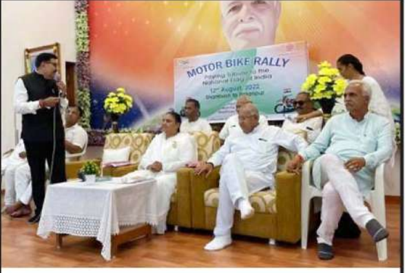
માઉન્ટ આબુથી પાલનપુર સુધી બ્રહ્માકુમારીઝ દ્વારા તિરંગા બાઈક રેલીનું આયોજન કરાયું

પાલનપુર, તા. ૧૩ હિંમતનગર થી મેરવાડ સુધી નેશનલ હાઈવે-૫૮ સરકાર દ્વારા જાહેર કરવામાં આવેલ છે. વડગામ અને ખેરાલુ તાલુકાને જોડતા નેશનલ હાઈવે-૫૮ ઉપર અને પિલૂયા ચોકડી પર પાણી ભરાતું હતું જેને લઈ ગત ચોમાસાએ નેશનલ ઓથોરિટીના અધિકારીઓએ ત્યાં ચેમ્બર બનાવી ગટર નાંખી સરસ્વતી નદીમાં ગટર લાઈન કાઢી પાણીનો નિકાલ કર્યો હતો. આ ચોમાસાએ જ્યાં પાણી ભરાઈ રહે છે તે ગટરની ચેમ્બરમાં માટી ભરાઈ જવા પામી છે અને ચેમ્બરના ઢાંકણા તૂટી ગયા છે. વારંવાર વરસાદ પડવાથી ત્યાં પાણી ભરાય છે આથી વાહનચાલકો પરેશાની ભોગવી રહ્યાં છે ત્યારે જવાબદાર અધિકારીએ ચોમાસા પહેલા ગટરની સાફ-સફાઈ કરાવી અને ઢાંકણા તૂટી ગયા છે તેની તપાસ કરવાની હોય છે. દરમ્યાન ગટર પુરાઈ જવાથી વાહનચાલકો પરેશાની ભોગવી રહ્યાં છે તે બાબતે હજુ સુધી કોઈ જ તપાસ નથી કરી. ત્યારે સરકાર દ્વારા જવાબદાર અધિકારીઓ સામે આ બાબતે યોગ્ય પગલાં ભરવામાં આવે તેવી વાહનચાલકોમાં માંગ ઉઠવા પામી છે.