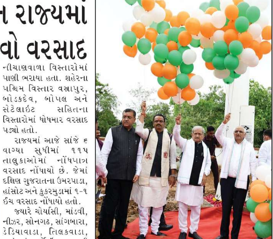
મુખ્યમંત્રી ભૂપેન્દ્ર પટેલે આઝાદીના અમૃત મહોત્સવ અંતર્ગત હર ઘર તિરંગા અભિયાનમાં જોડાઈને ગાંધીનગરમાં ચિલ્ડ્રન યુનિવર્સિટી ખાતે ૧૦૦ ફૂટના ધ્વજ દંડ ઉપર ૩૦x૨૦નો વિશાળ તિરંગો લહેરાવ્યો હતો આઝાદીના પ્રતિકરૂપે રંગબેરંગી ઠુગ્ગા ઉડાડીને મહોત્સવની ઉજવણી કરી હતી.

અમદાવાદ, તા. ૧૩ રાજ્યમાં આજે છૂટાછવાયા સ્થળે હળવો વરસાદ નોંધાયો હતો. બીજા તરફ હવામાન વિભાગે રાજ્યમાં આગામી પાંચ દિવસ સામાન્ય વરસાદની આગાહી કરી છે. આગામી તા. ૧૫ અને ૧૬ ઓગસ્ટના રોજ દક્ષિણ ગુજરાતમાં ભારે વરસાદ પડી શકે છે. આ ઉપરાંત બનાસકાંઠા અને સાબરકાંઠામાં