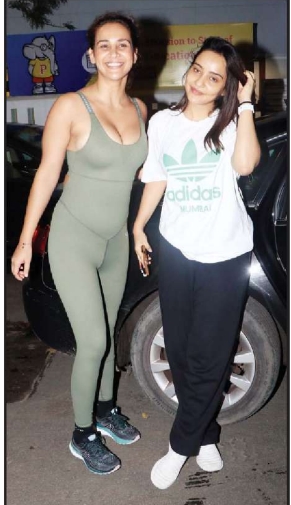
બોલીવુડ એક્ટ્રેસ નેહા શર્મા અને તેની બહેન આઈશા શર્મા પાપારાઝી કેમેરામાં ક્લીક થયા ત્યારે કેલચુલ ડ્રેસમાં જોવા મળી હતી.

જેનો ખુલાસો એક્ટ્રેસે પોતે જ એક ઈન્ટરવ્યૂ દરમિયાન કર્યો હતો. શું તે પણ લગ્ન કરતાં સૈફનું પ્રપોઝલ નકાર્યું હતું તેમ પૂછતાં કરીના કપૂરે કહ્યું હતું 'હા, મને હવે યાદ પડ્યો નથી. લગભગ તેમ બે કે તેથી વધુ વખત થયું હતું. પરંતુ સૌથી વધુ જરૂરી એ છે કે મેં હા પાડી'. સૈફના પ્રપોઝલને ફગાવવા પાછળનું કારણ જણાવતાં બેબોએ કહ્યું હતું 'હું ત્યારે પણ પ્રેમમાં હતી, અમે બંને માત્ર એકબીજાને થોડા ઓળખી રહ્યા હતા. મને લાગે છે કે, આ તેના કારણે હતું, માત્ર આટલું જ. પરંતુ મને લાગે છે કે, મને હંમેશાથી ખાતરી હતી કે હું તેની સાથે લગ્ન કરવાની છું'. કરીના કપૂર અને સૈફ અલી ખાન-તૈમૂર અને જેલ તેમ બે દીકરાના માતા-પિતા છે. લગ્નના ચાર વર્ષ બાદ ૨૦૧૬માં તૈમૂરનો જન્મ થયો હતો જ્યારે તેમના ઘરે બીજું સંતાન ગયા વર્ષે ફેબ્રુઆરીમાં આવ્યું હતું. આ વર્ષે ઓક્ટોબરમાં કપલના લગ્નજીવનને એક દશકો પૂરો