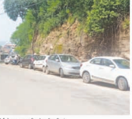
कोर्ट रोड पर सड़क किनारे खड़ी गाड़ियां।

नए बिलासपुर शहर को आस्तित्व में आए हुए लगभग 63 वर्ष हो गए हैं, लेकिन आज भी नए बिलासपुर शहर को पार्किंग सहित अन्य कई प्रकार की समस्याओं से जूझना पड़ रहा है। इनमें शहर की सीवरेज, कूड़े के लिए ड्रॉपिंग साइट कई अन्य ऐसी समस्याएं हैं, जिन्हें समाधान आज तक नहीं हो पाया है। इसमें एक शहर के प्रमुख सार्वजनिक स्थानों पर लोगों को गाड़ियां पार्किंग करने के लिए पार्किंग स्थल नहीं है, जहां पर स्थानीय शहरवासियों, दूरदराज के ग्रामीण क्षेत्र से आने वाले लोग एवं विभिन्न शिक्षण संस्थानों व विभागों में काम करने वाले कर्मचारी अपने वाहनों को व्यवस्थित तरीके से खड़े कर सकें। स्थानीय शहर में एक