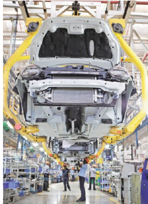
Component sales to OEMs dropped 3% to ₹2.29 trillion in FY21, as per Acma.

Malyaban Ghosh malyaban.g@livemint.com NEW DELHI