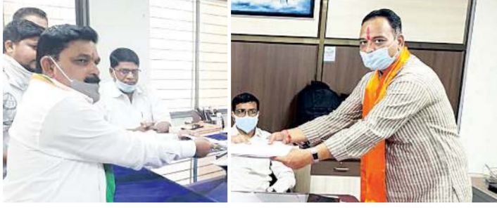
ભાજપના જઈ સામે કોંગ્રેસના જઈ તથા આપના ૩૪ ઉમેદવારોએ ફોર્મ ભર્યા