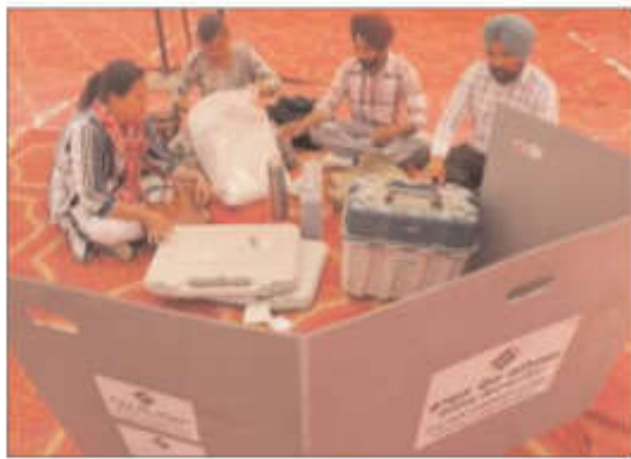
पटियाला में ईवीएम को मतदान केंद्रों पर ले जाने की तैयारी करते अधिकारी।