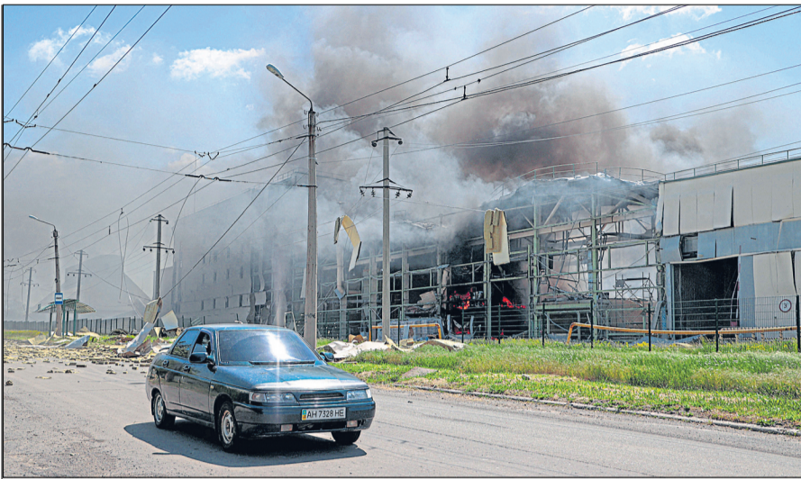
यूक्रेन के बखमुट शहर में रूसी सेना ने शुक्रवार को नागरिक इलाकों को भी निशाना बनाया।

वहीं, ब्रिटेन की खुफिया रिपोर्ट में बीते दिनों दावा किया गया था कि रूस की योजना इस शहर पर कब्जा करने की है। ब्रिटेन के रक्षा मंत्रालय ने कहा कि रूस ने क्षेत्र में बढ़त बनाने के लिए इजिप्सम के निकट 22 बटालियन सार्विक समूहों को तैनात कर रखा है। रूस के तथाकथित बटालियन सामरिक समूह में पैदल सेना की इकाइयां शामिल हैं, जो टैंक, हवाई रक्षा उपकरणों और तोपों से लैस हैं। प्रत्येक इकाई में लगभग 800 सैनिक हैं। हालांकि यूक्रेनी बलों ने रूसी सेना को शहर के बाहर ही रोक रखा और दोनों ओर से कड़ा संघर्ष किया जा रहा है।