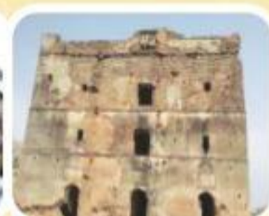
किला एवं महल परिसर, नवरत्नगढ़, झारखंड