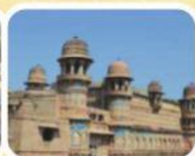
ग्वालियर किला, ग्वालियर