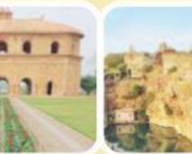
चित्तौड़गढ़ किला, राजस्थान