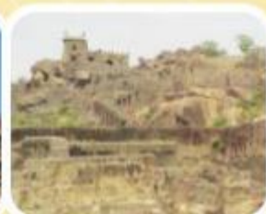
गोलकोडा किला, हैदराबाद