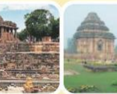
सूर्य मंदिर, कोणार्क