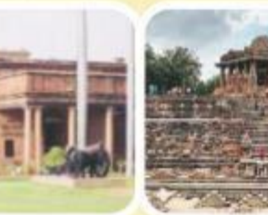
मोढेरा सूर्य मंदिर, गुजरात