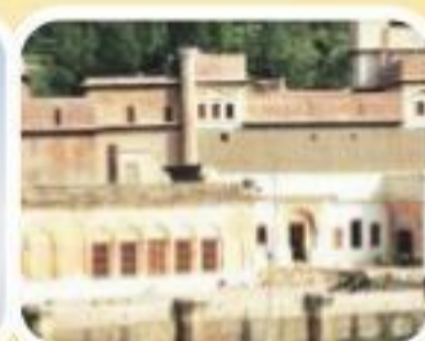
रामनगर पैलेस, जम्मू