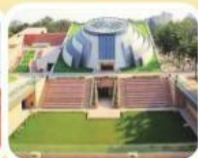
प्रधानमंत्री संग्रहालय, नई दिल्ली