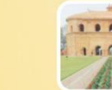
रंग घर, शिवसागर, असम