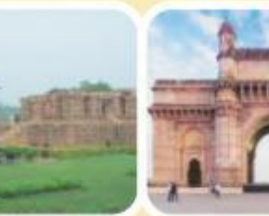
गेटवे ऑफ़ इंडिया, मुंबई