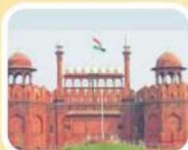
लाल किला, दिल्ली

29 अप्रैल, 2023 | संध्या 7:00 से 8:00 बजे तक