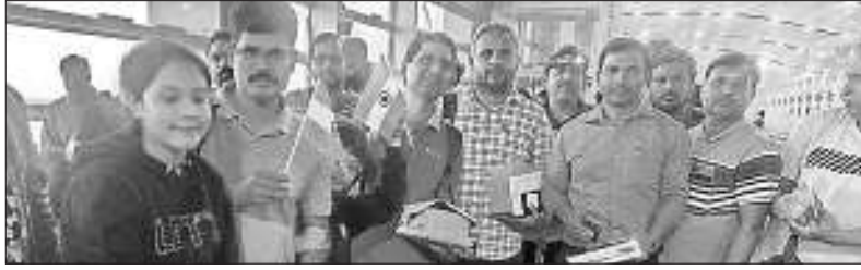
सूडान से शुक्रवार को बंगलुरु पहुंचा भारतीयों का जत्था।

स्थानीय निवासियों ने खार्तूम के काफौरी में भीषण संघर्ष की सूचना दी। इससे पहले, इसी मार्च पर सेना ने अपने प्रतिद्वंद्वी पैपिड सपोर्ट फोर्स पर बमबारी करने के लिए युद्धक विमानों का इस्तेमाल किया था। सेना के मुख्यालय, सूडान में राष्ट्रपति के आवास हरिपब्लिकन पैलेसह और