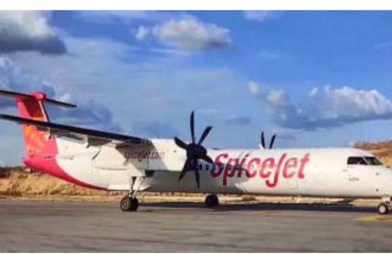
కళానిధి మారన్-స్పైన్ జెట్ కేసులో ఇచ్చిన ఆర్డీట్రల్ అవార్డ్ అమలు దిశగా సుప్రీంకోర్టు సోమవారం కీలక ఆదేశాలు జారీ చేసింది.

న్యూఢిల్లీ: కళానిధి మారన్-స్పైన్ జెట్ కేసులో ఇచ్చిన ఆర్డీట్రల్ అవార్డ్ అమలు దిశగా సుప్రీంకోర్టు సోమవారం కీలక ఆదేశాలు జారీ చేసింది. రూ.270 కోట్ల బ్యాంకు గ్యారంటీని వెంటనే నగదుగా మార్చుకుని, ఆ మొత్తాన్ని కళానిధి మారన్, ఆయనకు చెందిన కల్ ఎయిర్వేస్ కు చెల్లించాలని స్పైన్ జెట్ ను ఆదేశించింది. పెండింగ్ లో ఉన్న రూ.578 కోట్లకు గాను ఇప్పటికే రూ.308 కోట్ల నగదు చెల్లించామని స్పైన్ జెట్ ఉన్నత న్యాయస్థానానికి తెలిపిన తర్వాత ఈ నిర్ణయం తీసుకుంది. ఆర్డీట్రల్ అవార్డ్ లో రూ.75 కోట్లను మూడు నెలల్లోగా కళానిధి మారన్, కల్ ఎయిర్వేస్ కు చెల్లించాలని చీఫ్ జస్టిస్ డివై