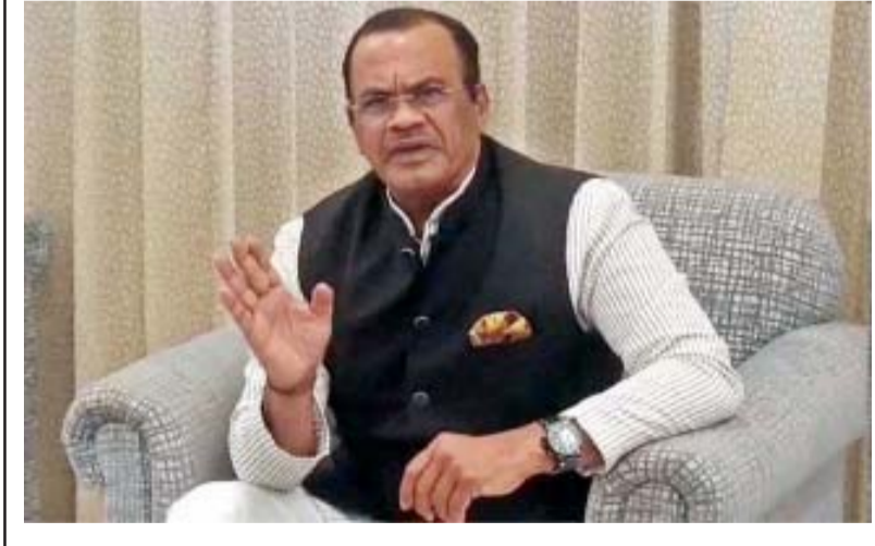
కోమటిరెడ్డి వెంకటరెడ్డి సంచలన వ్యాఖ్యలు చేశారు.

న్యూఢిల్లీ: తెలంగాణలో పొత్తులపై కాంగ్రెస్ ఎంపీ కోమటిరెడ్డి వెంకటరెడ్డి సంచలన వ్యాఖ్యలు చేశారు. 2024 ఎన్నికల్లో వచ్చేది హంగ్ అసెంబ్లీనేనని అన్నారు. ఎన్నికల ఫలితాల్లో.. ఏ పార్టీకి స్పష్టమైన మెజార్టీ రాదని పేర్కొన్నారు. కాంగ్రెస్-బీఆర్ఎస్ కలవక తప్పదని పేర్కొన్నారాయన.