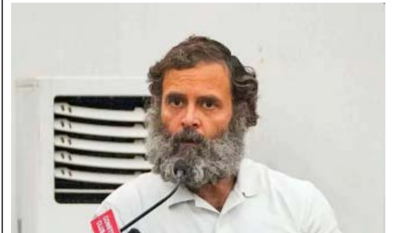
రాహుల్ గాంధీ ప్రయాణంపై అకస్మిక రద్దుపై కాంగ్రెస్ రాజకీయ విమర్శకు దిగింది.

లక్నో: రాహుల్ గాంధీ ప్రయాణంపై అకస్మిక రద్దుపై కాంగ్రెస్ రాజకీయ విమర్శకు దిగింది. సోమవారం అర్ధరాత్రి లాల్ బహదూర్ శాస్త్రి విమానాశ్రయం(యుపీ)లో షెడ్యూల్ ప్రకారం విమానం ల్యాండ్ అవ్వాలి ఉంది. ఇత అనుహ్యంగా చివరి నిమిషంలో అది కాస్త క్యాన్సిల్ అయ్యింది. దీంతో అధికారుల ఒత్తిడికి తలొగ్గి ల్యాండ్ ఇంగ్ చేసేందుకు ఎయిర్పోర్ట్? అధికారులు నిరాకరించారంటూ ఆరోపణలు చేసినది కాంగ్రెస్.