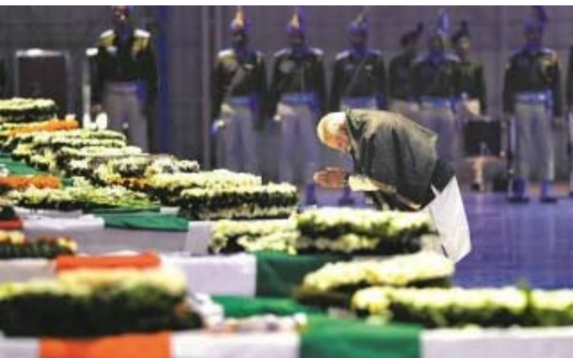
ప్రధాని మోదీ పుల్వమా అమరులకు నివాళులు అర్పించారు.

న్యూఢిల్లీ: పుల్వమా ఉగ్రదాడిలో అమరులైన జవాన్లకు ప్రధాని నరేంద్ర మోదీ నివాళులు అర్పించారు. ఈ ఘటన జరిగి నాలుగేళ్లయిన నందర్పంగా వారిని స్మరించుకున్నారు. పుల్వమా అమరుల త్యాగాన్ని దేశం ఎన్నిటికీ మరువదని, దేశాభివృద్ధికి వీర సైనికుల శౌర్యమే స్ఫూర్తిగా ఉంటున్నారని, ఈమేరకు ఆయన మంగళవారం ఉదయం ఢిల్లీలో చేశారు. 2019 ఫిబ్రవరి 14న జమ్మూకశ్మీర్ పుల్వమాలో సీఆర్పీఎఫ్ కాన్వాయ్ పై ఉగ్రదాడి జరిగిన విషయం తెలిసింది. ఈ ఘటనలో 40 మంది భారత జవాన్లు అమరులయ్యారు. ఇందుకు ప్రతీకారంగా