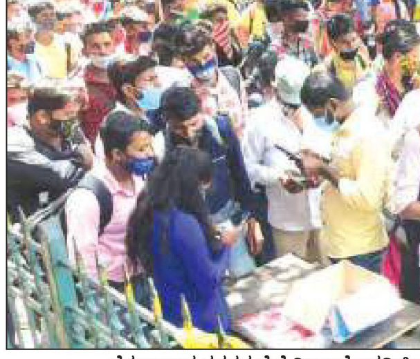
ದೇಶದಾದ್ಯಂತ ನಗರದ ರೈಲ್ವೆ ನಿಲ್ದಾಣಕ್ಕೆ ಆಗಮಿಸಿದ ಪ್ರಯಾಣಿಕರಿಗೆ ಸ್ವಾಸ್ಥ್ಯ ಟೆಸ್ಟಿಂಗ್ ಮಾಡುತ್ತಿರುವುದು.