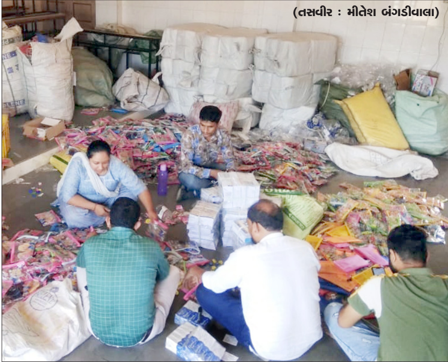
સેવક એજ્યુકેશન ચેરિટેબલ ટ્રસ્ટ દ્વારા બાળકોને વિનામૂલ્યે પુસ્તકોનું વિતરણ કરવામાં આવશે.