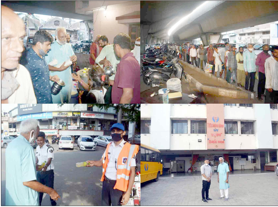
પથ વિજય ભગવાન ધર્મચક્ર ચેરિટેબલ ટ્રસ્ટ દ્વારા શનિવારે પીપલોદ સ્થિત દિવાંગ ભવન, જિલ્લા સેવા સદન, બેલ્ચિયમ સ્કેવર, દિલ્હીગેટ, ત્રિકમનગર અને કમલપાર્ક ખાતે ઉઠાળો, મારુક, નાસ્તાનું વિતરણ કરાયું હતું અને ઉના પાણી રોડ પર ચાલતા અન્નકેન્દ્ર ખાતે છાશ પૂરી પાડવામાં આવી હતી.