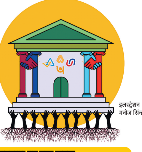
इलस्ट्रेशन : मनोज सिन्हा