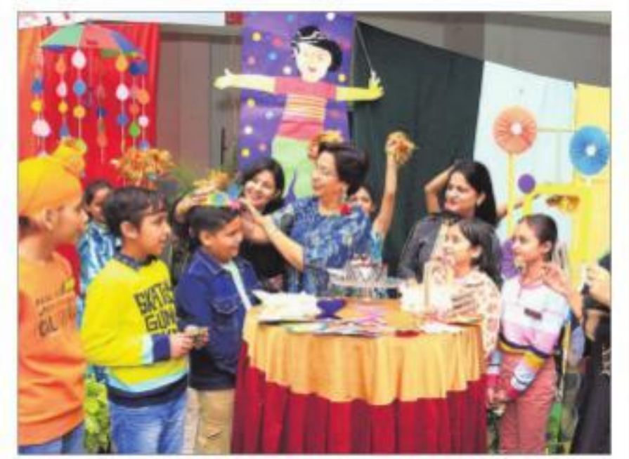
Students celebrate Children's Day at Police DAV Public School, Jalandhar, on Monday.