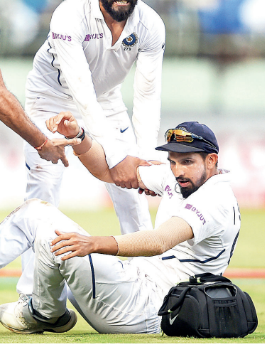
खांदा म्हणजे ३४ खेळाडूंना गुडघ्याची दुखापत आहे. ज्या खेळाडूंना घोट्याची दुखापत आहे त्यांची संख्या ११.४८ टक्के, मांडीच्या स्नायूची दुखापत असलेले खेळाडू १०.४९ टक्के तर पाठीच्या खालच्या भागाला दुखापत असलेले खेळाडू ७.५४ टक्के आहेत. नडगीचे

की, एप्रिल २०१९ ते मार्च २०२० या कालावधीत २६२ क्रिकेटपटू एनसीएत पुनर्वसनासाठी होते. त्यात २१८ पुरुष आणि ४४ महिला क्रिकेटपटूंचा समावेश होता. या खेळाडूंपैकी १४.७५ टक्के खेळाडूंना (पुरुष व महिला) खांद्याची दुखापत होती. २६.२पैकी असे ३८ खेळाडू आहेत. तर १३.११ टक्के