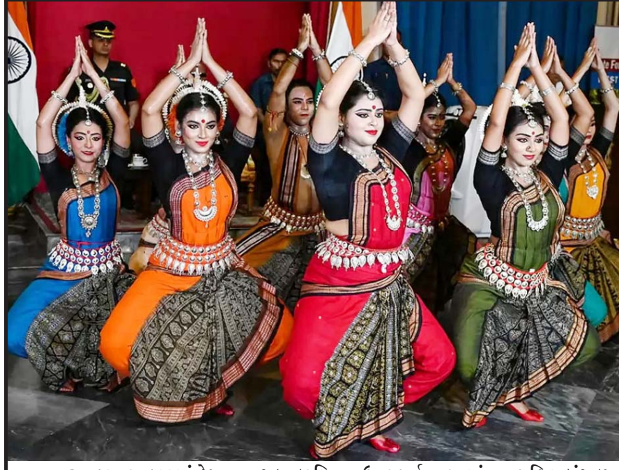
તા. ૨૦ જૂન ૧૯૪૭માં દેશના ભાગલા દરમિયાન ઉત્તર પૂર્વ ભારતમાં નવા પશ્ચિમ બંગાળ રાજ્યની થયેલી સ્થાપના દિવસની રાજ્યના પાટનગર કોલતામાં રાજભવન ખાતે ઉજવણી દરમિયાન મહિલા નૃત્ય કલાકારો ભારતીય શાસ્ત્રીય નૃત્ય પરકર્મો કરી રહી છે.

વધારો થઈ શકે છે. આ સાથે જ આ સમસ્યા ખૂબ ભયાનક થઈ જશે. જો ઠાણેમાં ભારે વરસાદ પડે તો પાણીના નિકાલ માટે કુલ ૧૭ ગટર રેલી તેમાંથી ૮ સમુદ્ર સપાટીથી નીચે છે જ્યારે ૬ દરિયાની સપાટીથી ઊંચા છે પરંતુ તેમાંથી ત્રણ પાણીની સપાટીથી ઊંચર છે જે ભરતી વખતે થાય છે. આવી સ્થિતિમાં ઠાણેને ભારે વરસાદની સ્થિતિમાં પાણી પૂરનો સામનો કરવો પડશે. ઠાણેના ડિઝાસ્ટર મેનેજમેન્ટ વિભાગે નવ એવા સ્થળોની ઓળખ કરી છે જ્યાં પાણી ભરાઈ જવાની મોટી સમસ્યા છે. સંશોધકોને વિશ્વાસ છે કે આ નકશો અધિકારીઓને મદદ કરી શકે છે. સંશોધકોએ પૂરની સમસ્યાનો સામનો કરવા માટે ઠાણે મ્યુનિસિપલ કોર્પોરેશનને કેટલીક સલાહ આપી છે. આ સ્ટડીમાં કહેવામાં આવ્યું છે કે, કોર્પોરેશનને ધ્યાનમાં રાખવું જોઈએ કે, જે સ્ટ્રક્ચર્સ વિકસાવવામાં આવી રહ્યા છે તે ૪.૫ મીટર ઊંચા અથવા ઉચ્ચ ભરતીના સ્તર કરતાં વધુ હોવી જોઈએ. આ સાથે પાણીનો સંગ્રહ કરવા માટે ટાંબાઓ, સિંચણ સિસ્ટમ અને ટાઈડલ ગેટનો ઉપયોગ કરવા માટે કહેવામાં આવ્યું છે.