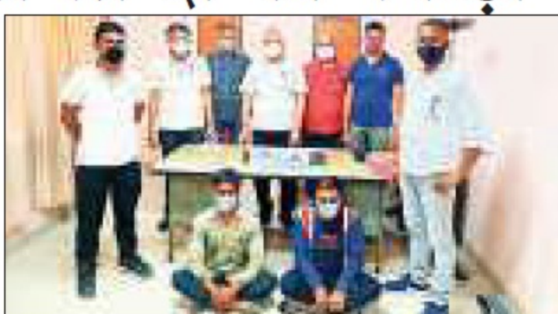
पुलिस गैंग के बाकी मेंबरों की तलाश में छापेमारी कर रही है।