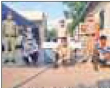
आरोपियों पर कई केस दर्ज हैं।