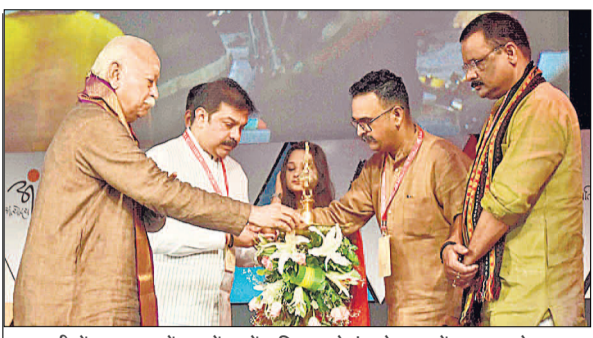
वाराणसी में रुद्राक्ष कन्वेंशन सेंटर में शनिवार को इंटरनेशनल टेंपल कॉन्वलेव का उद्घाटन करते संघ प्रमुख मोहन भागवत व अन्य।

वाराणसी, कार्यालय संवाददाता। आरएसएस के सरसंघचालक मोहन भागवत ने कहा कि मंदिरों का संचालन-प्रबंधन कौन करता है, यह महत्वपूर्ण नहीं है। कहीं सरकार के हाथों में प्रबंधन है तो निजी प्रबंधन के भी श्रेष्ठ उदाहरण हैं। महत्वपूर्ण यह है कि मंदिर संचालन के लिए भक्ति भाव और प्रबंधक या संचालक का भक्त होना जरूरी है। उन्होंने कहा कि मंदिर भक्ति के साथ शक्ति के भी केन्द्र बनने, यह समय की आवश्यकता है।