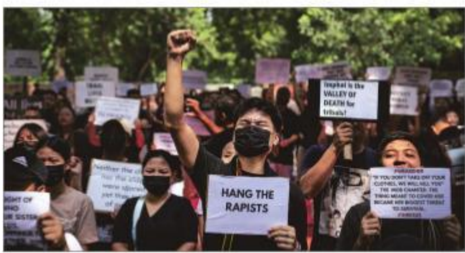
Protesters in New Delhi during a demonstration against ethnic clashes in Manipur

The next day, police made the first arrest in connection with the incident. A man who was part of the mob that paraded the women at B