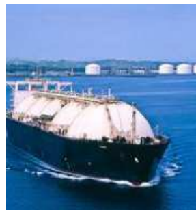
The work on the project is expected to start by July

MARKET VOLATILITY BPCL CMD G Krishnakumar told analysts that crude oil prices have remained well below $90 per barrel in last three months, notwithstanding announcements of crude oil supply cuts by major suppliers. This resilience is attributed to