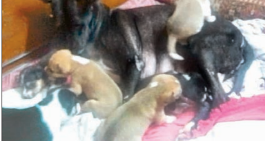
তখনও মায়ের পিঠে চড়ে খেলাছিল ওরা।

তিনি বলেন, '১৬ তারিখ রাতে কুকুরছানাগুলিকে বিষ খাইয়ে মেরে ফেলা হয়েছে। এমন নিম্ন কাজ কী করে কেউ করতে পারল। পাড়ার যুবকরা আমাকে জানিয়েছেন কুকুরছানাগুলি ভাত খাওয়ার পরই রক্তবমি করে। ১৭ তারিখ থেকে ওদের আর দেখা যাচ্ছে না। যারা এমন নিষ্ঠুর কাজ করেছে, তাদের কঠোরতম শাস্তি দিতে হবে। গত ৩১ জানুয়ারি ওই কুকুরছানাগুলি আমাদের বাড়িতেই জমায়েছিল। ৬টা বাছাকে হারিয়ে ওদের মায়ের এখন পাগলপারা অবস্থা।' অভিযোগ পাওয়ার পরই ঘটনাস্থলে তদন্তে যায় হাওড়া থানার পুলিশ। স্থানীয় মানুষদের সঙ্গে কথা বলেন তদন্তকারী পুলিশ অফিসারেরা। হাওড়া সিটি পুলিশের এক কর্মী জানান, 'ঘটনার তদন্ত চলছে। কীভাবে, কারা কুকুরছানাগুলিকে মেরেছে, তা জানতে এলাকার সিসিটিভির ফুটেজ খতিয়ে দেখা হচ্ছে। অতিযুক্তদের চিহ্নিত করে শিগগিরই গ্রেপ্তার করা যাবে বলে আশা করা হচ্ছে। এই ঘটনায় জড়িত কাউকেই রেয়াত করা হবে না।'