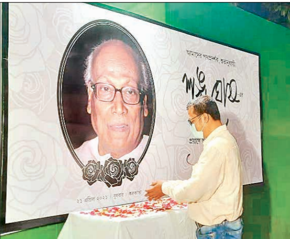
উত্তর কলকাতা উদয়ের পথে-র শঙ্খাঞ্জলি, হেদুয়া পার্কে।