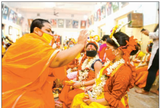
রামনবমী উপলক্ষে আদ্যপীঠে কুমারী পূজো। বৃহবার।

করোনা সংক্রমিত রোগীদের চিকিৎসা প্রসঙ্গে মুখ্যমন্ত্রী বলেন, 'হাসপাতালে যদি কোনও জায়গা না থাকে, সেই পরিস্থিতিতে সেই হাসপাতাল কর্তৃপক্ষ অন্য হাসপাতালের সঙ্গে যোগাযোগ করে যাতে চিকিৎসা পরিষেবা দেওয়ার ব্যবস্থা করে দেয়, সেই নির্দেশও দেওয়া হয়েছে। আমরা বিভিন্ন হাসপাতালের সঙ্গে অনেক সেক্ষ হাউসকে যুক্ত করছি। এখন আমাদের ১১ হাজার বেড আছে। ১৩ হাজার হয়ে যাবে। রাজ্যের হাসপাতালে করোনা রোগী ৬,৭৯০ জন। বাড়িতে রয়েছে ১১,৫৯০ জন। সরকারি হাসপাতালে করোনায় রোগী রয়েছে ৩,৫৮৮ জন। বেসরকারি হাসপাতালে রয়েছে ২,৫০৫ জন। ইতিমধ্যে আমরা ৮০টি বেসরকারি হাসপাতাল নিয়ে ফেলছি। ৭০টি কোভিড হাসপাতাল নতুন করে করা হয়েছে। বেডের সংখ্যাও বাড়ানো হচ্ছে।'