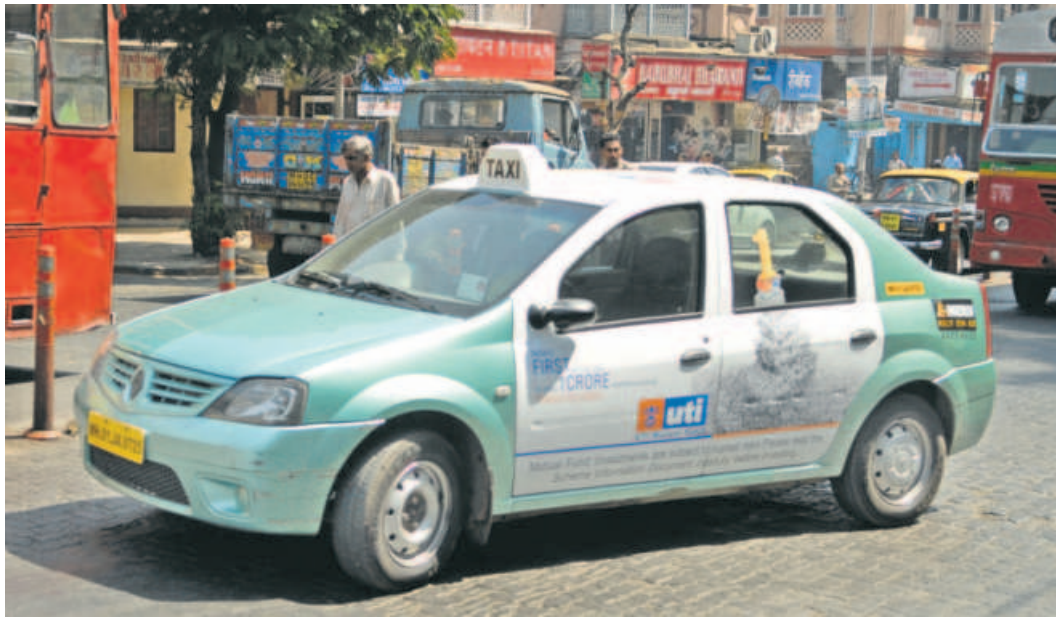
For the year ended 31 March, the revenue of Meru's holding entity declined for the second straight year. MINT

"Mahindra's investment will help Meru plan for a new course of