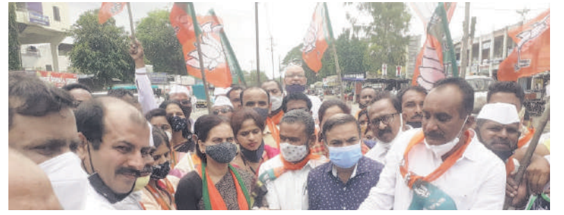
ओबीसी आरक्षणासाठी निफाड याठिकाणी खा. डॉ.भारती पवार यांच्या नेतृत्वाखाली चक्काजाम आंदोलन करण्यात आले. ओबीसी राजकीय आरक्षण पुन्हा लागू करण्याची ज़रूरत मागणी यावेळी करण्यात आली.