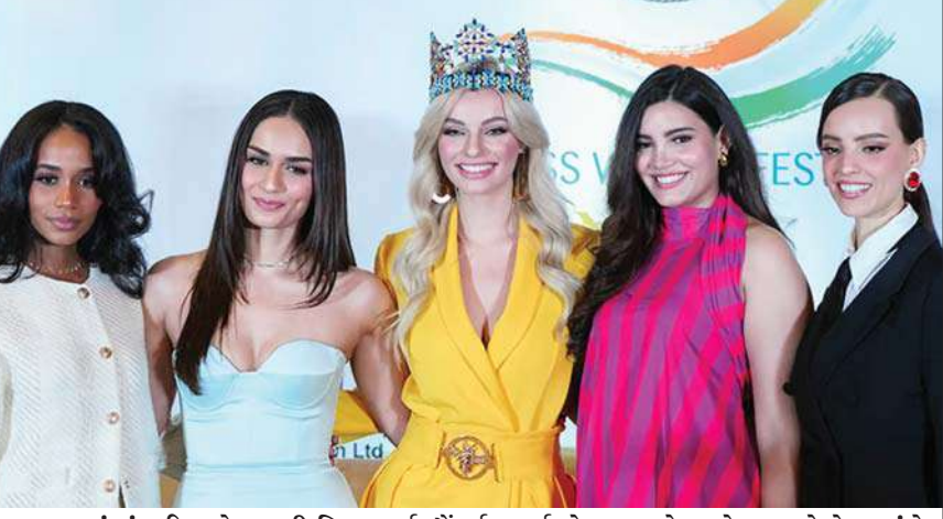
ભારતમાં મુંબઈ ખાતે ૭૧મી મિસ વર્લ્ડ સૌંદર્ય સ્પર્ધા યોજનાર છે ત્યારે શુક્રવારે તેના અંગે નવી દિલ્હીમાં યોજાયેલા પ્રેસ લોન્ચ દરમિયાન ઉપસ્થિત પોલેન્ડની ૭૦મી મિસ વર્લ્ડ કેરોલિના બીલીવસ્કા (વચ્ચે) ભૂતપૂર્વ મિસવર્લ્ડ સુંદરીઓ જૈમ્કોની ટોની એવ સિંઘ, ભારતની માનુષી છિલ્લર, પ્યુર્ટોરિકોની સ્ટેફાની ડેલ વાલે અને મેક્સિકોની વાનેસા પોન્સ ડી લીઓન સાથે પોઝ આપી રહી છે.

વડાપ્રધાન દ્વિવટર પર પોસ્ટ કરી છે જેમાં ચૌધરી ચરણસિંહ, નરસિંહા રાવ અને વૈજ્ઞાનિક એમ એસ સ્વામીનાથનની સિદ્ધિઓ ગણાવી છે અને તેમને ભારત રત્ન એવોર્ડ આપવામાં આવશે તેમ જણાવ્યું છે. ચૌધરી ચરણસિંહ વિશે તેમણે લખ્યું છે કે દેશના પૂર્વ વડાપ્રધાન ચૌધરી ચરણસિંહને ભારત રત્નથી સન્માનિત કરવામાં આવી રહ્યા તે અમારી સરકાર માટે સૌભાગ્યની વાત છે. તેમણે દેશ માટે આપેલા બેજોડ યોગદાન માટે આ સન્માન અપાઈ રહ્યું છે. તેમણે પોતાનું સમગ્ર જીવન ખેડૂતોના હક અને કલ્યાણ માટે સમર્પિત કર્યું હતું. યુપીના મુખ્યમંત્રી હોય કે દેશના ગૃહમંત્રી, તેમણે હંમેશા રાષ્ટ્ર નિર્માણ માટે કામ કર્યું હતું. ઈમરજન્સી દરમિયાન તેમણે લોકશાહી પ્રત્યે પ્રતિબદ્ધતા દર્શાવી હતી અને દેશને પ્રેરણા આપી હતી.