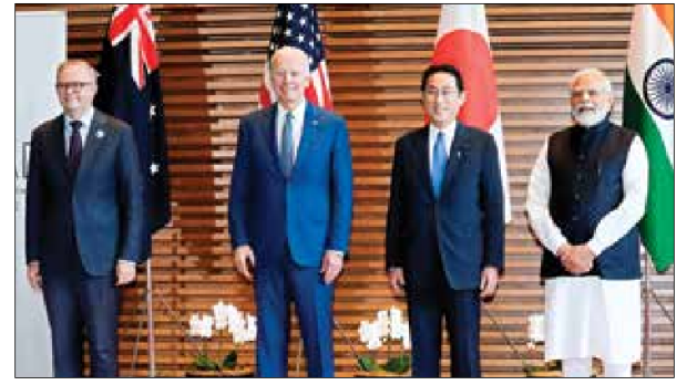
Leaders of Quadrilateral Security Dialogue (Quad) from left to right, Australian Prime Minister Anthony Albanese, U.S. President Joe Biden, Japanese Prime Minister Fumio Kishida, and Indian Prime Minister Narendra Modi, pose for photo at the entrance hall of the Prime Minister's Office of Japan in Tokyo, Japan, Tuesday

"We are proud to have delivered over 670 million doses, including at least 265 million