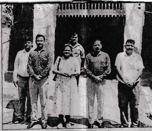
नेत शिविर में मौजूद जेल अधीक्षक व अन्य।

856/21 (SP) www.ncr.indianrailways.gov.in @CPRONCR