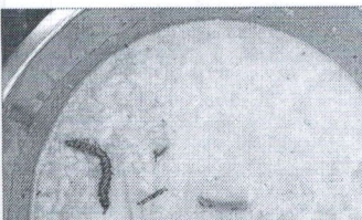
সহায়িকার কোনো হস্তক্ষেপ পাওয়া যায়নি। তবে রুগ্নের জন্ম, ক্রিয়া/কলাপের রাসা ওয়ার্ডের খিচুরিতে বিচ্ছেদ ঘটানোর ঘটনা নিয়ে বিপুল ডাক্তারের একটি প্রতিবেদন প্রকাশিত হয়েছে।

বিপুল ডাক্তার, বর্ধমান : বর্ধমান পুরপ্রাঙ্গণের রাসা ওয়ার্ডের অঙ্গনওয়াড়ি কেন্দ্রের রাসা ওয়ার্ডের খিচুরিতে বিচ্ছেদ ঘটানোর ঘটনা নিয়ে বিপুল ডাক্তারের একটি প্রতিবেদন প্রকাশিত হয়েছে। এতে বলা হয়েছে, বর্ধমান পুরপ্রাঙ্গণের রাসা ওয়ার্ডের অঙ্গনওয়াড়ি কেন্দ্রের খিচুরিতে বিচ্ছেদ ঘটানোর ঘটনা নিয়ে বিপুল ডাক্তারের একটি প্রতিবেদন প্রকাশিত হয়েছে। এতে বলা হয়েছে, বর্ধমান পুরপ্রাঙ্গণের রাসা ওয়ার্ডের অঙ্গনওয়াড়ি কেন্দ্রের খিচুরিতে বিচ্ছেদ ঘটানোর ঘটনা নিয়ে বিপুল ডাক্তারের একটি প্রতিবেদন প্রকাশিত হয়েছে।