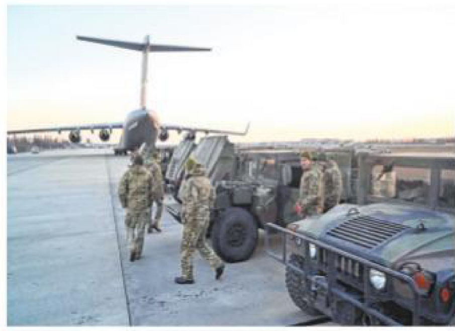
Servicemen of Ukrainian Military Forces examine the High Mobility Multipurpose Wheeled Vehicle (HMMWV) military trucks shipped from Lithuania to Boryspil airport in Kyiv on Sunday.

cation were underway on Sunday with the help of video footage. A mob stoned a middle-aged man to death in a village of Khanewal district on Saturday.