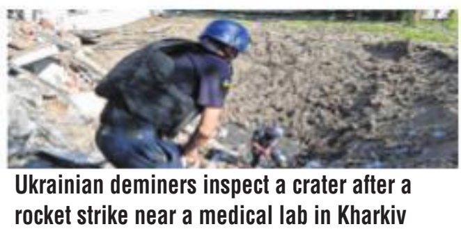
Ukrainian deminers inspect a crater after a rocket strike near a medical lab in Kharkiv

In his nightly video address, Ukrainian President Volodymyr Zelenskyy invoked the 1986 disaster at the Chernobyl nuclear plant in Ukraine, which at the time was a Soviet republic.