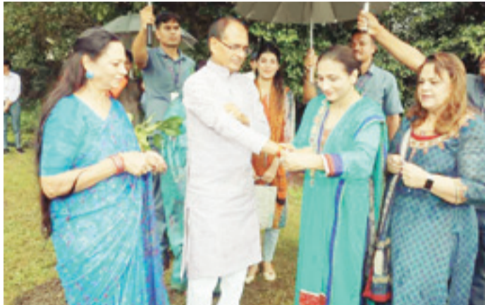
भोपाल। मुख्यमंत्री शिवराज सिंह चौहान को बेगम्स ऑफ भोपाल लेडीज क्लब की सदस्यों ने राखी बांधी।