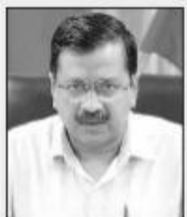
अरविंद केजरीवाल, मुख्यमंत्री

दिल्ली के मुख्यमंत्री अरविंद केजरीवाल ने रविवार को टवीट कर कहा कि दिल्ली में रह रहे प्रवासी मजदूरों की जिम्मेदारी हमारी है। अगर वो दिल्ली में रहना चाहते हैं तो उनका पूरा ख्याल रखेंगे और अगर वो अपने गांव लौटना चाहते हैं, तो उनके लिए ट्रेन का इंतजाम कर रहे हैं। किसी भी हालत में उन्हें बेसहारा नहीं छोड़ेंगे। मुख्यमंत्री ने टवीट कर बताया कि सभी अधिकारियों को आदेश जारी किए हैं कि किसी प्रवासी को कोई तकलीफ न हो। जितनी जरूरत होगी, उतनी ट्रेन का इंतजाम किया जाएगा। वहीं, उप मुख्यमंत्री मनीष सिसोदिया ने बताया कि फंसे हुए प्रवासी