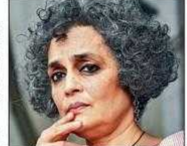
अरुंधति रॉय 196 के तहत मंजूरी दी थी। रॉय और हुसैन ने 21 अक्टूबर 2020 को एलटीजे ऑडिटोरियम में आजादी-द ओनली वे के बैनर तले आयोजित एक सम्मेलन में कथित तौर पर उतेजक और भारत विरोधी भाषण दिए थे। सम्मेलन में जिन

सुशील पंडित की ओर से 28 अक्टूबर 2010 को की गई रिक्वाइट के बाद यह FIR हुई थी। इसके तहत अरुंधति के खिलाफ 29 अक्टूबर 2020 को मामला दर्ज किया गया था। इससे पहले अक्टूबर 2023 में उपराज्यपाल ने आईपीसी की धारा 153ए/153बी और 505 के तहत अपराधों के लिए मुकदमा चलाने के लिए सीआईपीसी की मजूरी दे दी है।