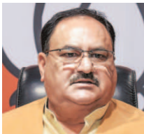
Union Health Minister J.P. Nadda on Friday chaired a high-level meeting on attaining targeted goals