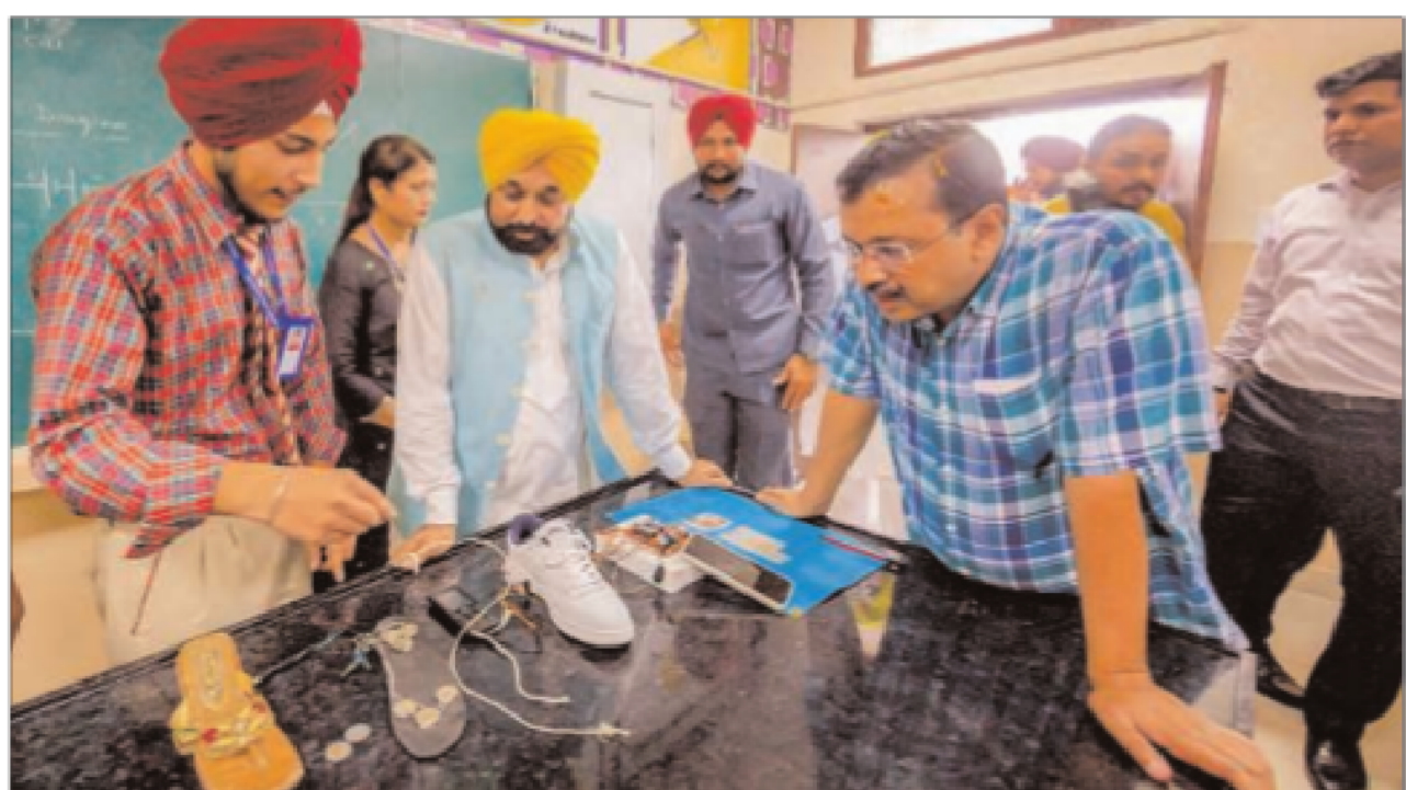
अमृतसर में बुधवार को 'उत्कृष्ट विद्यालय' के लोकार्पण पर छात्रों के साथ चर्चा करते अरविंद केजरीवाल और साथ में पंजाब के मुख्यमंत्री भगतवंत मान।