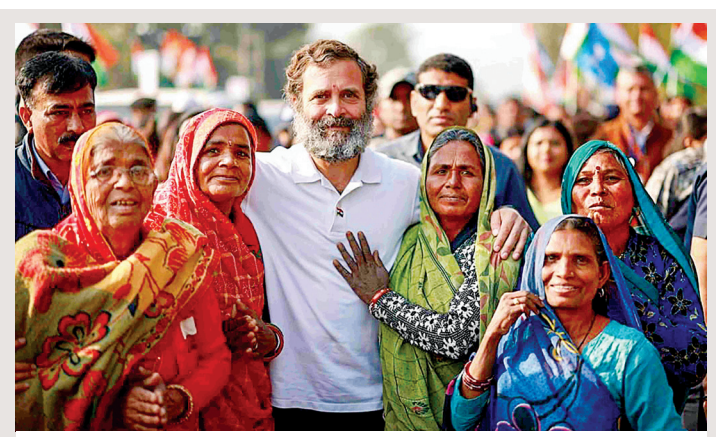
भारत जोड़ो यात्रा में राहुल गांधी ग्रामीण महिलाओं के साथ।

Nature Made Social System = Simple Social Order से Money Made Social System = Complex Social Order में परिवर्तन के जिस संक्रमण काल से हम गुजर रहे हैं उस पर भरोसा करने का ताजा प्रमाण यह है कि कांग्रेस नेता राहुल गांधी गत कुछ असें से भारत जोड़ो यात्रा करते हुए इन दिनों राजस्थान में चलने वाली 17 दिन की यात्रा कर रहे हैं उसका कोई स्पष्ट लक्ष्य एवं मिशन नहीं है, अतः यह माना जा सकता है कि वे Welfare State Capitalism से पैदा होने वाले ऐसे Complex Social System में से दिशा ढूँढने की कोशिश कर रहे हैं जो कांग्रेस पार्टी के भविष्य को संवारने में काम आये या यों कहें कि Politics v/s Economics की जंग में जीत का हथियार बनने की क्षमता दर्शाये। विकासशील समाज व्यवस्था का यह दौर चूँकि जीवन की आवश्यकता के पर्याय रोटी-कपड़ा-मकान जैसे पुराने पड़ चुके मुद्दों पर आगे नहीं बढ़ता क्योंकि ऐसा सब सरकार से हासिल करना जनता के नये संवैधानिक अधिकार बनते चले जाते हैं, अतः लोग Dream, Desire and Design पर चलने वाले ऐसे भविष्य को हासिल करने में व्यस्त नजर आते हैं जिसमें शारीरिक परिश्रम-पुरुषार्थ एवं उत्पादन