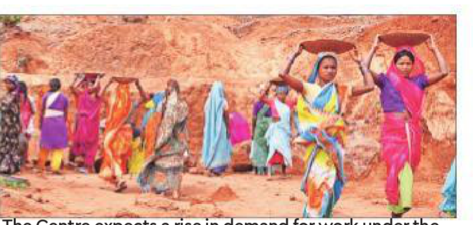
The Centre expects a rise in demand for work under the rural jobs scheme. In the interim Budget speech, finance minister Nirjala Sitharaman had said: "Two crore (20 million) more houses will be taken up in the next five years to meet the requirement arising from the increase in the number of families." Since MGNREGA is a demand-driven programme, funds will be allocated as per the requirement, the official said.

holds declining 10% year-on-year. In the interim Budget for 2024-25, the allocation for MGNREGS was ₹86,000 crore. The allocation in the revised estimate for 2023-24 was the same, and official sources say, the allocation was around this level.