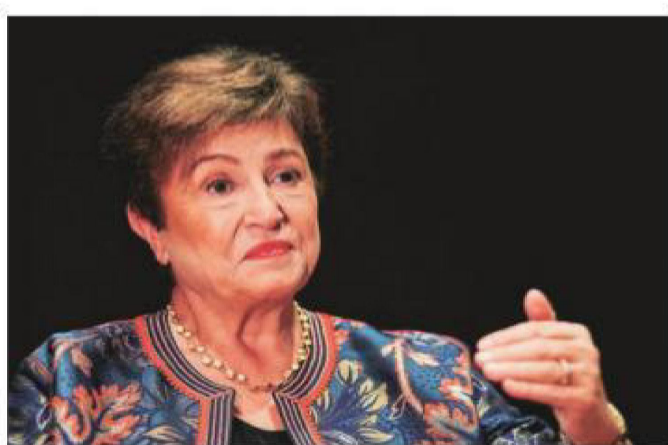
IMF MD Kristalina Georgieva

The decision came after several discussions between Georgieva, who was the sole candidate for the job, and the IMF executive board, the fund said in a statement. The board commended Georgieva's "strong and agile