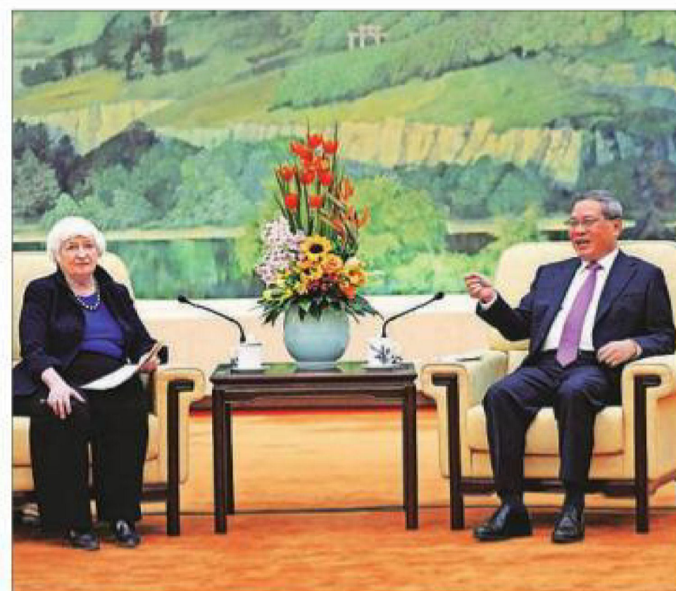
US treasury secretary Janet Yellen with Chinese premier Li Qiang

A US official, who asked not to be identified discussing internal deliberations, said the issue of overcapacity is a concern for many of China's major trading partners and the department expects the issue to be discussed next week. China's support for its domestic industries has drawn complaints from competitors since it joined the World Trade Organization two decades ago. They argue that direct and indirect government support has