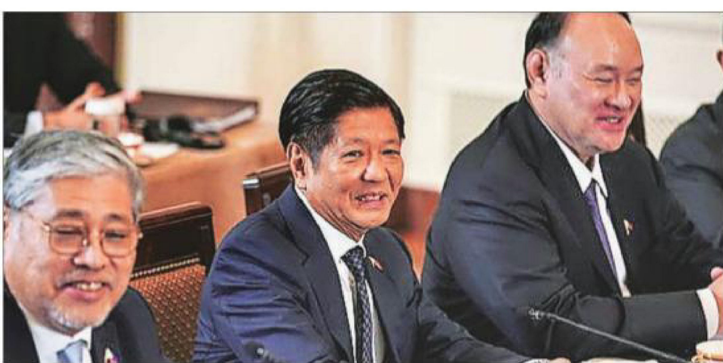
Philippine President Ferdinand Marcos Jr (middle) during the trilateral summit at the White House in Washington