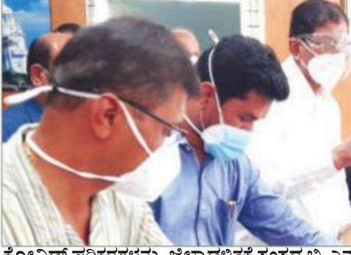
ಕೋವಿಡ್ ಪರಿಕರಗಳನ್ನು ಜಿಲ್ಲಾಡಳಿತಕ್ಕೆ ಸಂದ ಬಿ.ಎನ್.ಬಚ್ಚೇಗೌಡ ಹಸ್ತಾಂತರಿಸಿದರು.

ಸಂ.ಕ.ಸಮಾಚಾರ. ದೇವನಹಳ್ಳಿ ರಾಜ್ಯದಂತೆ ಲಾಕ್‌ಡೌನ್ ಕ್ರಮಗಳನ್ನು ಸಮರ್ಪಕವಾಗಿ ಅನುಷ್ಠಾನಗೊಳಿಸಿದ ಪರಿಣಾಮ ರಾಜ್ಯ ಸೇರಿದಂತೆ ಬೆಂಗಳೂರು ಗ್ರಾಮಾಂತರ ಜಿಲ್ಲೆಯಲ್ಲಿ ಕೋವಿಡ್ ಸೋಂಕಿನ ಪ್ರಮಾಣ ಗಣನೀಯವಾಗಿ ಇಳಿಕೆಯಾಗಿದೆ ಎಂದು ಚಿಕ್ಕಬಳ್ಳಾಪುರ ಲೋಕಸಭಾ ಕ್ಷೇತ್ರದ ಸದಸ್ಯರಾದ ಬಿ.ಎನ್. ಬಚ್ಚೇಗೌಡ ತಿಳಿಸಿದರು.