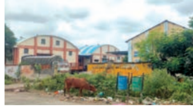
પાલિતાણા. હાલ મોંઘવારી પરાકાષ્ટાએ પહોંચી છે. તેવામાં ગરીબ અને સામાન્ય માણસને જીવનું મુશ્કેલ બન્યું છે. એક તરફ ગરીબ અને સામાન્ય લોકોને બે ટંક નિયમિત રોટલો મળતો નથી. તેવામાં પાલિતાણા હવામહેલ રોડ ઉપર આવેલ સરકારી અનાજના ગોડાઉનમાંથી તેલ ડબ્બા અને તુવેરદાળના અંદાજે ૧૦ લાખના જથ્થો ચોરી કરવાની ઘટના પ્રકાશમાં આવતાં જરૂરિયાતમંદના મોંઠે પહોંચેલો કોળિયો છીવાઈ જવાની સાથે ચોરાઈ ગયાનો ઘાટ ઘડાયો છે. જો કે, ડૂલ્કીકેટ ચાવીથી ગોડાઉનનું તાળું ખેલી મસમોદો જથ્થો ચોરી કરવાની ઘટનામાં કોઈને ગંધ શુદ્ધ ન આવતાં નવી જચાર્યાએ જન્મ લીધો છે.

અજાણ્યા તરકરો ડૂલ્કીકેટ ચાવીથી તાળું ખોલી ગોડાઉનમાંથી જથ્થો ચોરી ગયા અને કોઈને ગંધ શુદ્ધ ન આવી