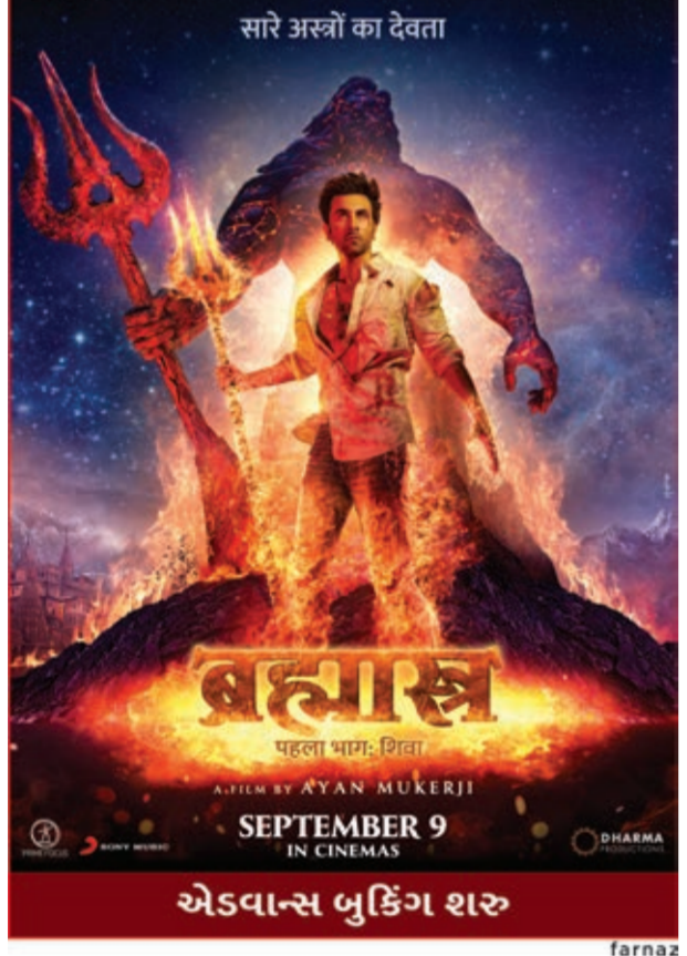
સારે અસ્કોં કા દેવતા

ભાવનગર : તંત્ર દ્વારા વૃદ્ધ તથા નિરાધાર વ્યક્તિઓ માટે ચૂંટણી કાર્ડ, આધાર કાર્ડ, તથા તેમના માટે મેડિકલ ચેકઅપ કેમ્પનું તા.૦૯ ના રોજ આયોજન કર્યું છે.