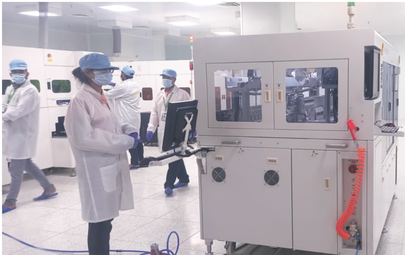
The chip assembly plant at Sahasra's factory in Bhiwadi is capable of packaging six- to 12-inch wafers