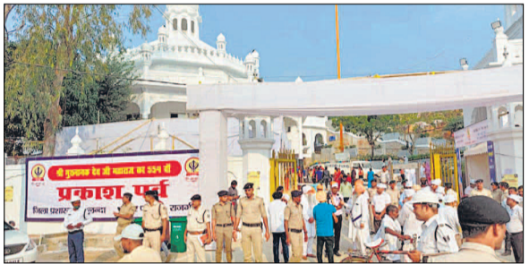
राजगीर में गुरुनानक कुंड स्थित नवनिर्मित गुरुद्वारा।

राजगीर, निज संवाददाता। सिख धर्म के संस्थापक गुरुनानक देव जी महाराज की 554वीं जयंती को 'गुरु प्रकाश पर्व' के रूप में मनाने के लिए राजगीर सज-धज कर तैयार है। तीन दिवसीय कार्यक्रम की शुरुआत गुरुवार की सुबह 9 बजे से 48 घंटे तक चलने वाले अखंड पाठ से होगी। इसमें शामिल होने के लिए इंग्लैंड के 200 सहित झारखंड, बंगाल, यूपी, दिल्ली, पंजाब, हरियाणा के साथ बिहार के विभिन्न जिलों से 500 सेवादर राजगीर पहुंच चुके हैं। कई अन्य देशों यथा आस्ट्रेलिया, नैरोबी, जर्मनी, कनाडा व फ्रांस से भी सेवादरों