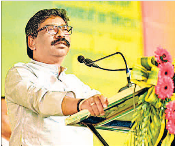
साहिबगंज में बुधवार को आपकी योजना आपकी सरकार, आपके द्वार कार्यक्रम के दौरान लोगों को संबोधित करते मुख्यमंत्री हेमंत सोरेन।

उधर, ईडी ने आज हेमंत सोरेन को पूछताछ के लिए बुलाया है। लेकिन प्रवक्त कार्यक्रम के चलते उनके ईडी दफ्तर जाने की संभावना कम है।