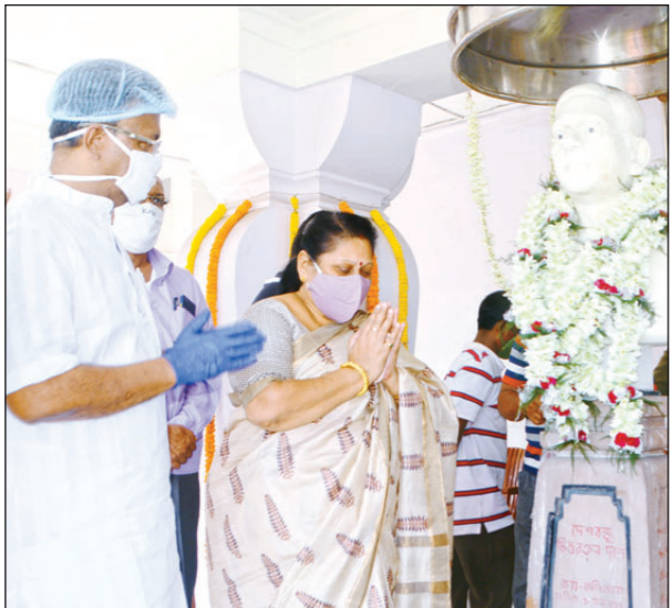
কেওড়ালা মহাশাশানে দেশবন্ধু চিত্তরঞ্জন দাশের মূর্তিতে শ্রদ্ধা জানাচ্ছেন পুর ও নগরোন্নয়ন মন্ত্রী ফিরহাদ হাকিম ও সাংসদ মালা রায়। বৃহস্পতিবার।