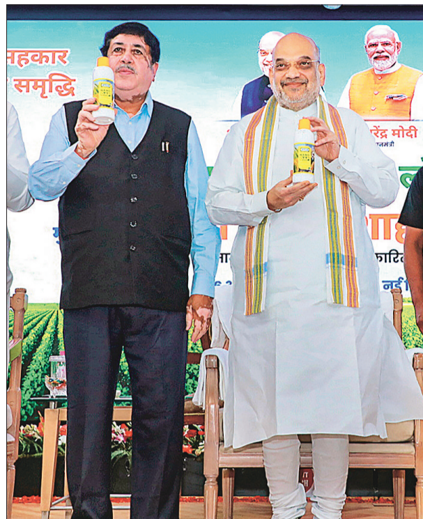
Union home and cooperation minister Amit Shah at the launch of Nano DAP (liquid) manufactured by IFFCO in New Delhi on Wednesday.

IFFCO has stated that a bottle of nano liquid DAP, the