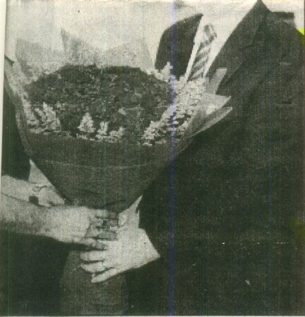
डे पैमाने पर अमेरिकी राजदूत, शमूएल डी। ब्राउनबैक ने नई दिल्ली में केंद्रीय अर अब्बास नकवी से मुलाकात की।