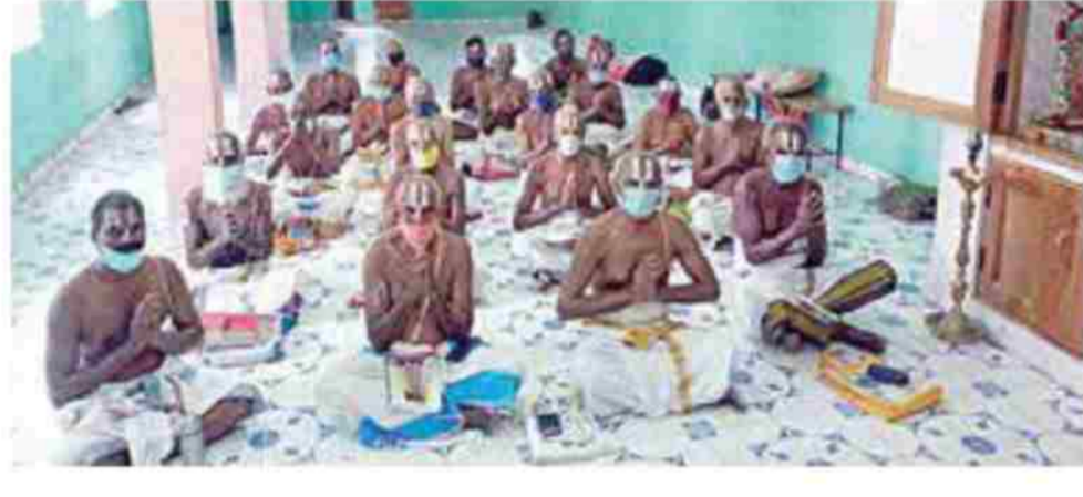
மாணவ் ரம் குலசேகர ராமா, ஹ்ர -தத்தில் உலக மக்களின் நன்மைக்காக வைணவ பாசுவர்கள் நலாயிற் திய பீரந்த பாபிரங்களை பாபு பிரார்த்தனை செய்தனர்.

திதாக கரோனா த ப்சி வரத் சோத நிலையில், 18 வயக்கு மேற்பட்டோர்க்கு த ப்சி போ ம் திடம், ஏற்கெனவே அறிவித்தபடி மே 1-ம் தேதி தொடங்க வாப்பில்லை. இவ்வா அவர் -நினார்.