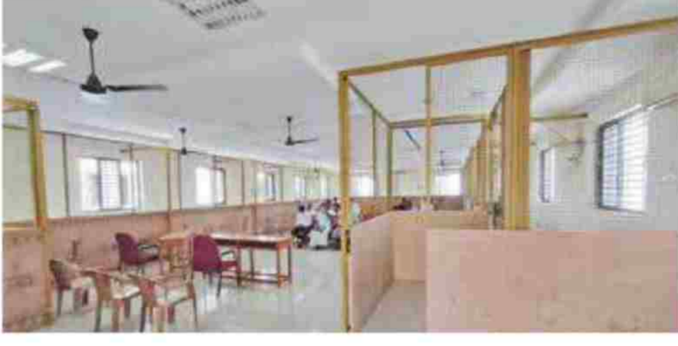
காஞ்சிபுரம் பொன்றைக்கரை பகுதியில் உள்ள அண்ணா பல்கலைக்கழகம் உட்பட பெரியில் கல்யாணியில் அமைக்கப்பட்ட வாக்கு எண்ணிக்கை மையம்.