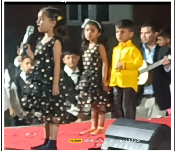
શહેરના પૂર્વ વિસ્તારમાં આવેલ એ. આઇ. એમ. ઇંગ્લીશ મીડિયમ સ્કૂલનો નવમો વાર્ષિકોત્સવ આણંદના ધારાસભ્ય યોગેશ પટેલની ઉપસ્થિતિમાં યોજાયો હતો. કાયેમના પ્રારંભે જુનીયર કે. ડી. ની વિદ્યાર્થીની અનમખાન પઠાણે મંગમુગ્ધ સ્વાગત સ્વીચ આપવા સાથે વિદ્યાર્થીઓ દ્વારા વિવિધ કૃતિ રજૂ કરવામાં આવી હતી. આ પ્રસંગે ધારાસભ્ય યોગેશ પટેલે વડાપ્રધાન મોદીનું કોષપદા બાળક શિક્ષણથી વંચિત ન રહે પર ભાર મૂકી વિદ્યાર્થીઓને ઉત્તરોત્તર પ્રગતિના આશીર્વાચન આપ્યા હતા. પ્રોગ્રામનું સફળ સંચાલન પ્રિન્સિપાલ રૂબીના પઠાણ દ્વારા કરવામાં આવ્યું હતું.