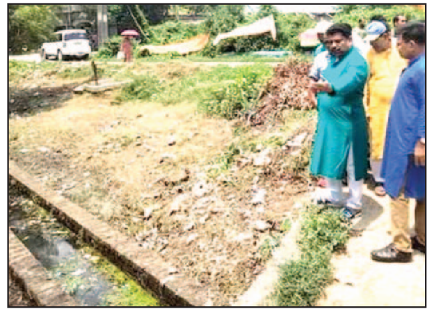
ফলে সামান্য বৃষ্টিতে জল জমে যাচ্ছিল। বিধায়ক হওয়ার পরে এলাকার লোকেরা জল সমস্যা মেটাতে বারবার অনুরোধ করতেন। এলাকা পরিবেক্ষণ করে ইঞ্জিনিয়ারদের দিয়ে নির্দিষ্ট পরিকল্পনা তৈরি করে বিভিন্ন জায়গায় তদারকি করে