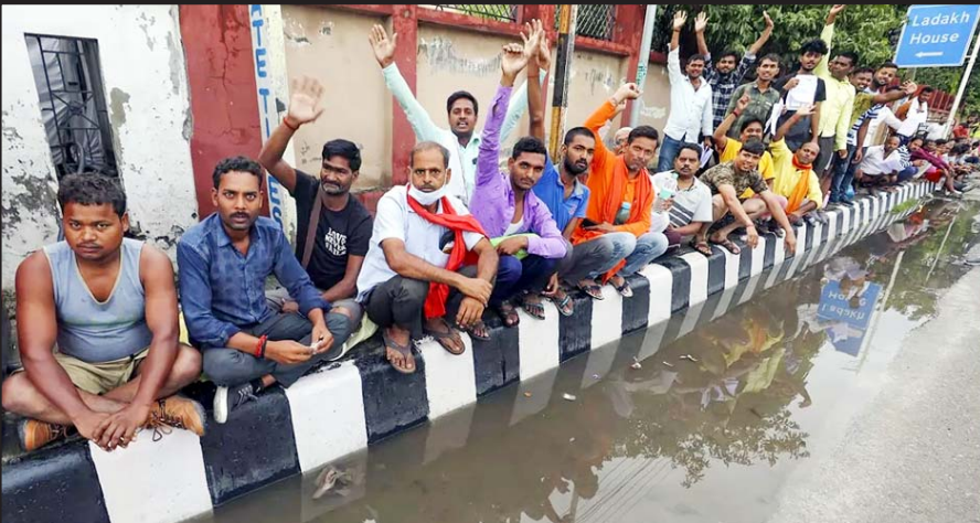
જમ્મુ કાશ્મીરમાં ભારે વરસાદના કારણે અમરનાથની યાત્રા બાલતાલ અને ચંદનવાડી આ બંને બેઠક કેમ્પ ખાતે સતત ત્રીજા દિવસે રોકી દેવામાં આવી હતી, પછી રવિવારે પુનઃ ચાલુ થઈ છે યાત્રામાં જવા શ્રદ્ધાળુઓનો ધસારો થઈ રહ્યો છે. જમ્મુ ખાતે અમરનાથ યાત્રાના રજિસ્ટ્રેશન સેન્ટર ખાતે યાત્રામાં જવા માટે શ્રદ્ધાળુઓ રાહ જોઈને બહાર લાઈનમાં બેઠેલા છે.

ભારતની બે દિવસની યાત્રા દરમિયાન વિક્રમસિંઘે વડાપ્રધાન મોદીને મળી શકે છે અને ઉર્જા, કૃષિ અને દરિયાઈ મુદ્દાઓ સંબંધિત અનેક ભારતીય પ્રોજેક્ટ્સના અમલીકરણને અંતિમ સ્વરૂપ આપશે. અહેવાલ અનુસાર, મત્સ્યોદ્યોગ મંત્રી ડબ્લ્યુ. કે. ગવર્ધન દેવાનંદ, ઉર્જા અને ઉર્જા મંત્રી કંચના વિજેસેકરા, વિદેશી બાબતોના મંત્રી અલી સાબરી