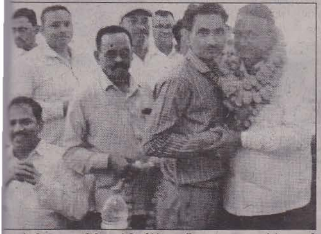
कः सेवानिवृत्त राजस्व निरीक्षक को विदाई देते सहकर्मी।