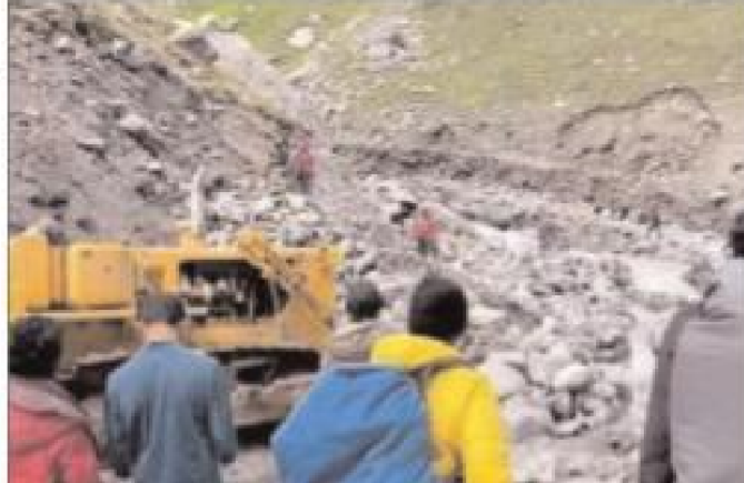
वाजिरी से जगह-जगह सड़क की हालत खरता हो गई है। इन दिनों भले ही पर्यटकों की आमद कम है लेकिन शिमला से किन्नौर होते हुए पर्यटक काजा पहुंच रहे हैं। काजा से पर्यटक मनाली की ओर आ रहे हैं। काजा से मनाली आ रहे पर्यटक छतड़ में फंस गए हैं लेकिन छतड़ में रहने व खाने पीने की बेहतर व्यवस्था से परेशानी

ग्राम्फु-काजा मार्ग पर बाढ़ ने फिर से कहर ढाया है। डोहरनी नाले के बाढ़ अब उसके साथ वाले नाले में बाढ़ आने से लगभग 50 मीटर सड़क बह गई है। सड़क के क्षतिग्रस्त हो जाने से ग्राम्फु-काजा मार्ग पर सफर करने वाले पर्यटकों व राहगीरों की दिक्कत बढ़ गई है। हालांकि बीआरओ मार्ग बहाली में जुटा है लेकिन 50 मीटर सड़क के बह जाने से सड़क बहाल होने में समय लगेगा।