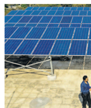
Fourth Partner has over 950 MW installed renewable capacity.

The company operates in Vietnam, Indonesia, Bangladesh and Sri Lanka, besides