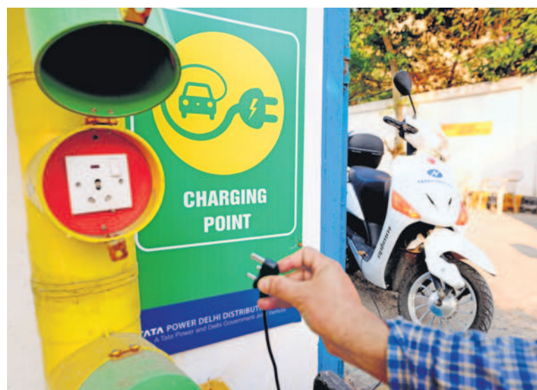
EV manufacturers are dispatching a record number of vehicles.

Despite EV manufacturers dispatching a record number of vehicles, penetration of e-two-wheelers saw a slight dip to 4.5% in October from 5% in September, as overall industry volumes grew far more than electric two-