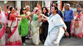
West Bengal CM Mamata Banerjee during a roadshow in Howrah on Wednesday