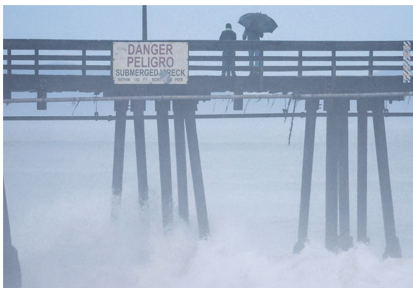
Hilary was downgraded from a hurricane to a tropical storm, but was still expected to bring flash floods, mudslides, isolated tornadoes and high winds.

Tropical Storm Hilary swirled northward Sunday just off the coast of Mexico's Baja California peninsula, no longer a hurricane but still carrying so much rain that forecasters said "catastrophic and life-threatening" flooding is likely across a broad region of the south-western US.