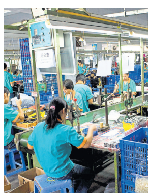
Last week, PBOC cut rates most since 2020.

Top leaders last week pledged to expand domestic consumption and support the private sector without detailing any new stimulus measures, the latest in a series of rhetorical attempts to boost confidence as markets sink. But officials have so far resisted rolling out major stimulus efforts, despite a pro-growth tilt signalled by the Communist Party's Politburo at the end of