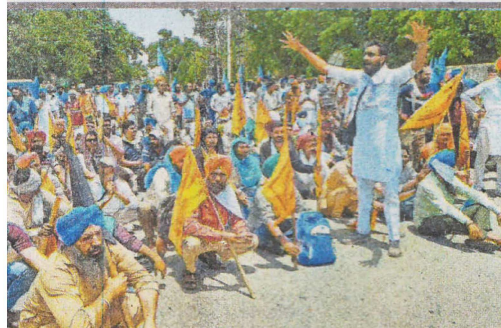
ਸ ਚੌਕ 'ਚ ਧਰਨੇ 'ਤੇ ਬੈਠੇ ਹੋਏ ਮੁਲਾਜ਼ਮ ਨਾਅਰੇਬਾਜ਼ੀ ਕਰਦੇ ਹੋਏ।