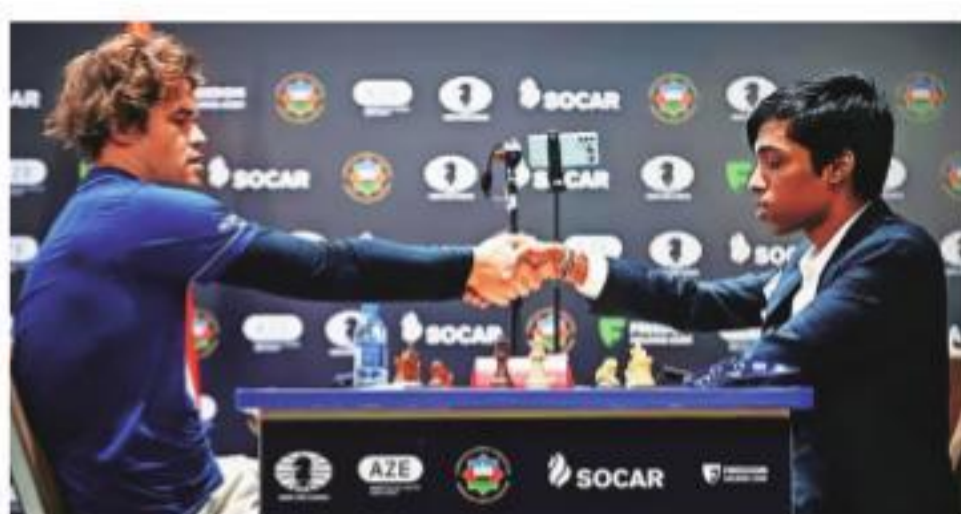
आयोजक, 'फिडे', डॉक्टर आणि परिचारिका यांचा मी आभारी आहे. त्यांनी मला चांगले उपचार मिळविले (अन्वत्तून विषबाधा झाल्याने) याची काळजी घेतली. माझ्या प्रकृतीत सुधारणा होती. मात्र, मी अजूनही पूर्ण शारीरिक क्षमतेने खेळू शकलो नाही. त्यामुळे विश्रांतीसाठी आणखी एक दिवस कसा मिळवता येईल याचा विचार करून मी खेळलो. गुरुवारी मला पूर्ण ताकदीने खेळता येईल अशी आशा आहे. प्रज्ञानंदने या स्पर्धेत काही आघाडीच्या बुद्धिबळपटूंना 'टायब्रेकर'मध्ये नमवले आहे. तो खूप चांगला खेळाडू आहे. परंतु, मला पूर्ण ताकदीने खेळणे शक्य झाले, तर मलाही विजयाची उत्तम संधी असेल. - मॅग्नस कार्लसन

मुंबई : भारताचा युवा ग्रँडमास्टर आर. प्रज्ञानंद आणि पाच वेळचा जगज्जेता मॅग्नस कार्लसन यांच्यातील विश्वचषक बुद्धिबळ स्पर्धेमध्ये अंतिम लढतीचा दुसरा डावही बरोबरीत सुटला. पारंपरिक पद्धतीच्या दोन्ही डावांअंती बरोबरी राहिल्याने आता जेतेपदाचा निकाल गुरुवारी 'टायब्रेकर'मध्ये लागेल.